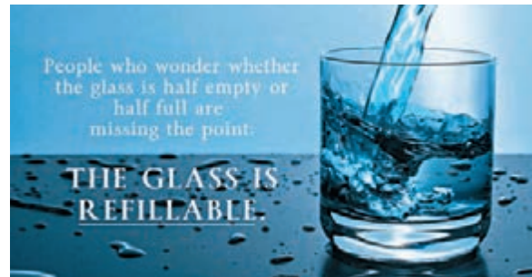
段崇智提醒「水杯半空還是半滿」的道理中，還有着不同可能性。

「今時今日全世界早已是四海一家，世界連繫」，段崇智認為以往所謂「閉門不理、獨善其身」的觀念已落後，為此學生考慮未來就業發展絕不應局限在本港，而是要放眼世界，「學生需要有此認同，讀書考試求分數只是一個步驟，最後的目的是要貢獻社會和人類」，而大學其中一個重要職責，就是要讓同學認識世界需要他的地方，並且努力發揮所長。