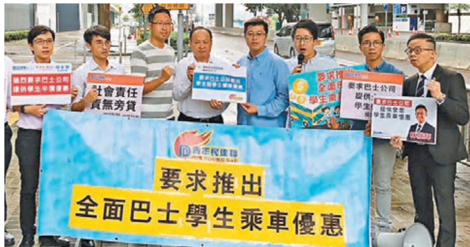
■青年民建聯要求巴士公司推出全面的學生乘車優惠。

香港文匯報訊（記者 姜嘉軒）巴士是本港主要的交通工具，不少學生返學放學都需乘搭。青年民建聯於開學日前到政府總部請願，呼籲各巴士公司承擔企業社會責任，為12歲至25歲的全日制學生提供半價乘車優惠，一方面巴士公司能樹立良好的社會形象，另一方面在經濟效益角度也可吸引更多學生搭巴士。