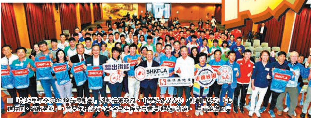
「新地單車學院2018先導計劃」啟動禮獲政府、中學及各界支持，計劃口號為「走進校園、踏出潛能」。首學年預計有200名學生接受專業場地單車訓練。單車總會圖片

昨午活動獲民政事務局長劉江華、行政會議成員林正財醫生、中國香港單車總會主席梁鴻德、新地執行董事郭基輝及香港學界體育聯合會主席劉麗娟擔任主禮嘉賓。