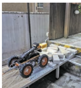
相關機械操作示範中