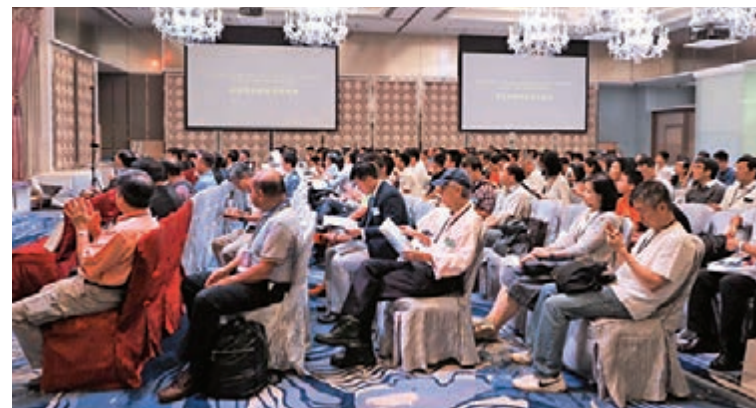
現場座無虛席，來賓們聚精會神地聆聽專家們的精彩演講。