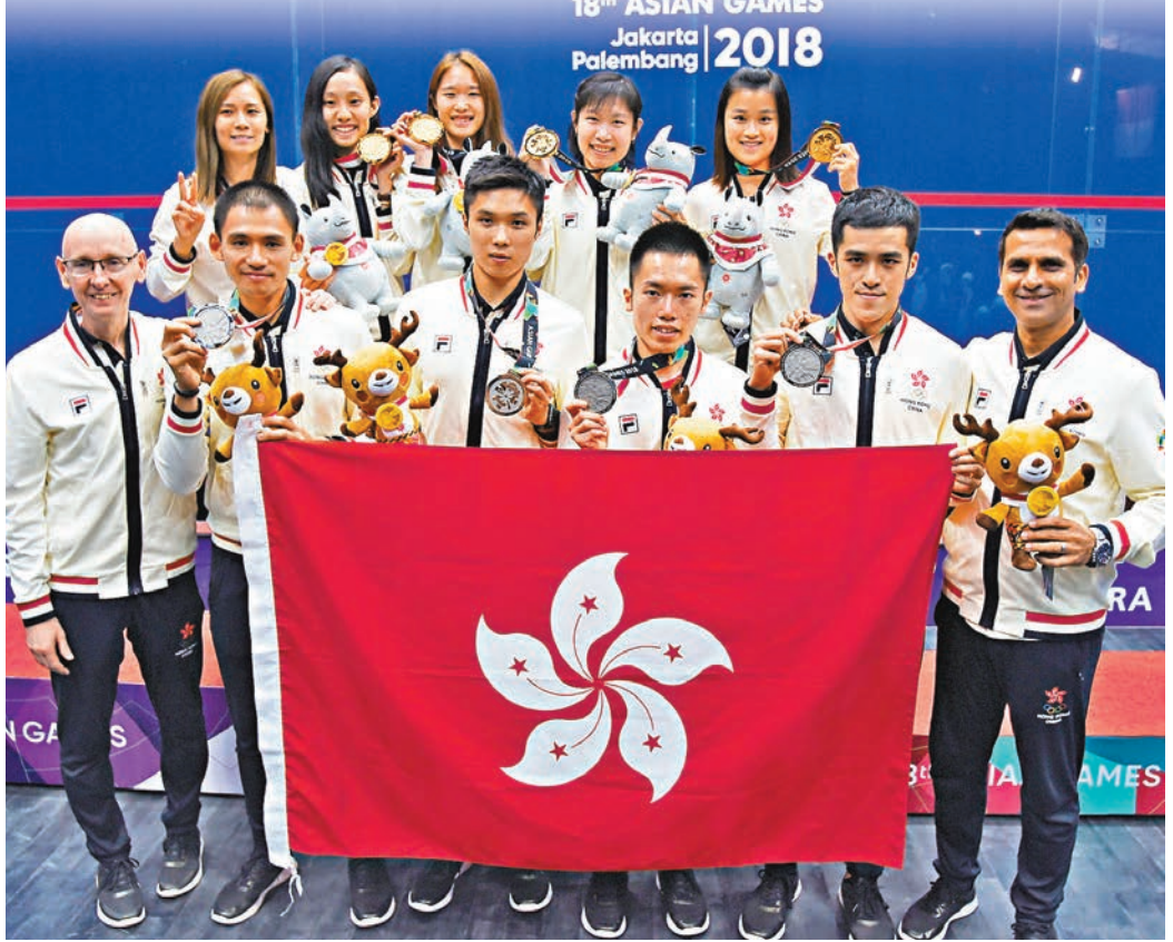
香港壁球隊在今屆亞運共奪2金2銀。