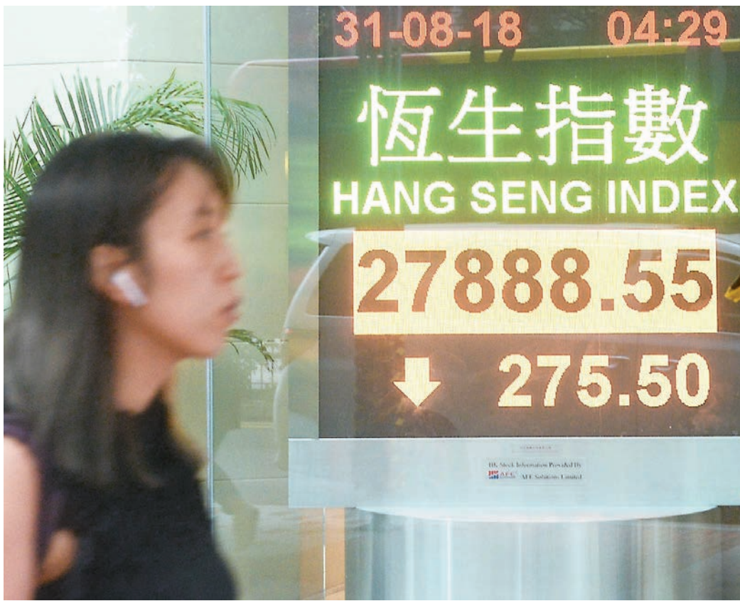
■ 新興市場危機加劇,拖累港股連跌第二日,全個8月份,大市仍跌694點。

香港文匯報訊(記者 周紹基)阿根廷貨幣暴瀉兩成,瘋狂加息15厘救亡,新興市場危機加劇;美國擬下周四(9月6日)對2,000億美元中國貨品加徵25%關稅,加上內地擬限制未成人上網玩遊戲的時間,打擊騰訊(0700)表現,在三大壞消息夾擊下,恒指昨日最多跌逾444點,全日仍跌275點,收報27,888點。雖然全周計,恒指仍有216點進賬,但全個8月份,大市仍跌逾2%,連跌第四個月,錄得兩年半以來的最長跌市,累跌2,920點。