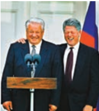
■葉利欽與克林頓通話曝光。