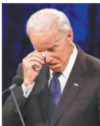
■拜登提起麥凱恩感觸落淚。

美國資深參議員麥凱恩上周末病逝，終年81歲，他在家鄉亞利桑那州的追悼會前日舉行，前副總統拜登獲邀致詞。拜登形容麥凱恩猶如他的兄弟，讚揚對方是美國跨黨派合作的「燈塔」，更一度感觸落淚。