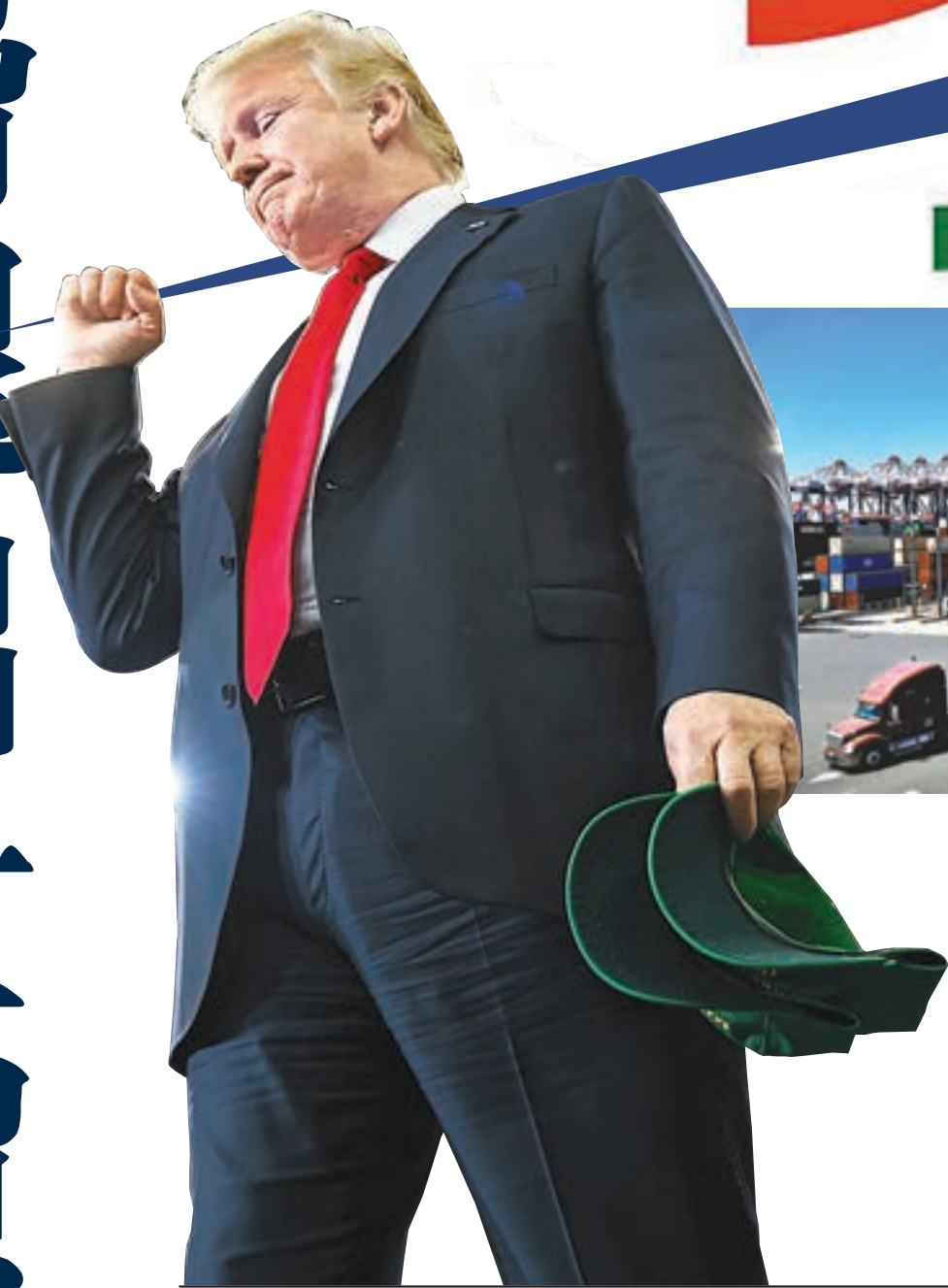
■美國一旦退出世貿將威脅全球經濟。