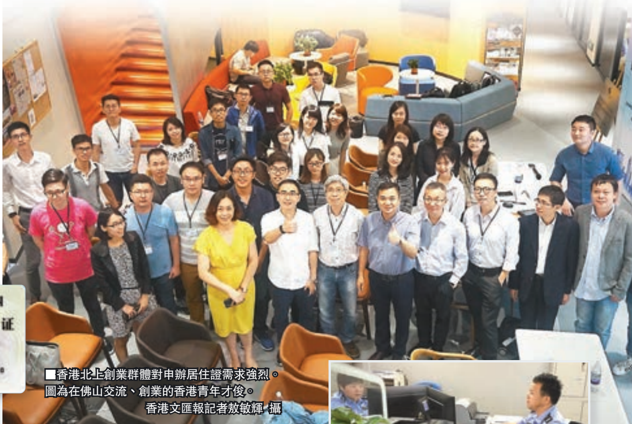
香港北上創業群體對申辦居住證需求強烈。圖為在佛山交流、創業的香港青年才俊。

香港文匯報訊（記者 敖敏輝、倪夢環 廣州、上海連線報導）內地多個省市今起正式受理港澳台居民居住證申請辦證，有關受理點已經準備就緒。昨日在廣州越秀區公安分局第一辦證廳，雖然還沒到辦理時間，但已經有不少港人到場諮詢及踩點。據悉，在內地居住生活的香港長者、大學生及創業者反應最為熱烈，連日來，工聯會廣州辦事處接到大量相關諮詢。有居滬港人則表明已提前準備好所有材料，計劃第一時間申領。他們表示，居住證能夠給在內地工作的港人帶來眾多便利，同時令他們更貼近祖國。