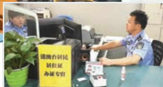
專人專窗辦理港澳台居民居住證，準備工作就緒。

Joyce表示，自己的崗位屬於亞太區，擁有內地居住證相信對於自己是一個非常有力的幫助，「我們公司今年還會參加中國國際進口博覽會，我也了解到，世界各國和地區的企業都會集聚中國，看到祖國越來越強盛，我們自然也感到高興，我也會和親友商量，進一步了解居住證可為港人帶來的實惠與便利。」