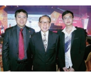
英皇集團主席楊受成(中)與莊紫祥博士及兒子合照

據了解，世界華商投資基金會於2003年創立世界傑出華人獎，至今已舉辦16屆，獲獎者超過300人。當晚主禮嘉賓包括：全國政協常委、中國僑聯副主席、世茂集團主席許榮茂；第十二屆全國政協常委、聯合國教科文組織和平藝術家、中國2008年北京奧運「福娃」之父韓美林；第十二屆全國政協常委、香港友好協進會會長戴德豐博士；第十二屆全國政協委員、香港河源社團總會主席吳惠權博士；第十、十一屆全國政協委員、香港文匯報榮譽顧問張國良；香港大學饒宗頤學術館館長、珠海書院校長李焯芬教授；香港演藝界協會永遠榮譽會長、著名導演許冠文；世界華人協會永遠榮譽會長、「中華慈善人物」、英皇集團主席楊受成博士；以及國際籃聯終身名譽主席、世界華人協會創辦人兼會長程萬琦博士。