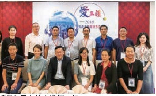
莊哲猛與雲南鶴慶縣教師一行

此次活動得到了雲南省僑聯名譽主席莊哲猛的全額資助和香港星星文化交流中心的協助，對老師們行程做了妥善的安排。莊哲猛希望通過此次的活動，老師們可以開拓自己的眼界，把香港優秀的教學理念和方式帶回雲南，讓雲南山區的學子們也能夠