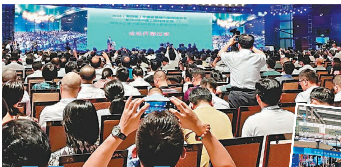
◀ 第十二屆中國智慧城市博覽會在深圳開幕，吸引了無數企業和政府代表。