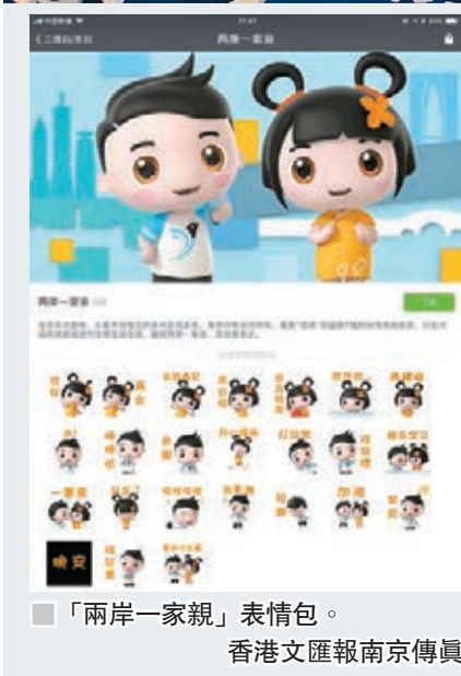
「兩岸一家親」表情包。