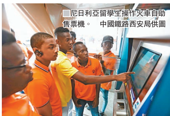
■尼日利亞留學生操作火車自助售票機。