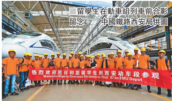
■留學生在動車組列車前合影留念。