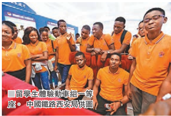
■留學生體驗動車組一等座。