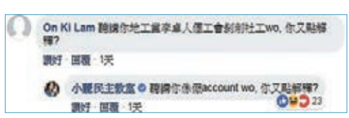
■ 唔知小麗老千對住九西新選民，係咪都咁有「性格」呢？