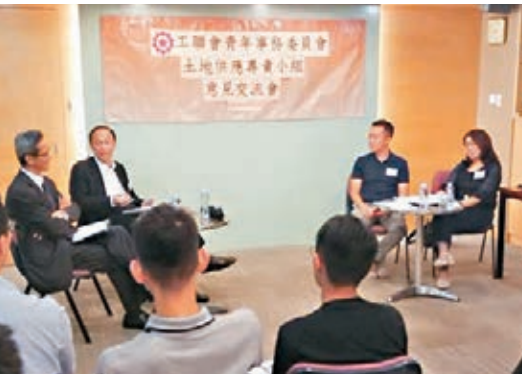
■ 工聯會青委與土地供應專責小組進行意見交流會。

香港文匯報訊（記者 文森）工聯會青年事務委員會近日與土地供應專責小組舉辦意見交流會，就香港土地供應涉及及長遠規劃交流看法，並為專責小組所提出之土地供應選項總提了相關意見及提出建議，包括先發展棕地、騰出土地興建公營房屋及填海造地等，希望扭轉現時香港土地不足之困境。