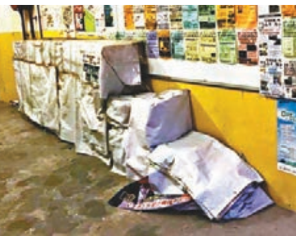
■ 區鎮權被踢爆佢疑似用雜物霸佔公眾地方。

「Tiger Golden」亦批評：「我住係條友果（嘢）區，選完之後就唔見咗人，上屆區議會出席率最差嘅議員，我屋企人話佢懶，話唔投佢，但最後都含淚投白鴿（民主黨），嚟緊唔使指（旨）意我再同（投）佢。」不過呢個大埔區議員唔知係係有關心大埔居民嘅事，定係睇到個 post 都扮見唔到，一直