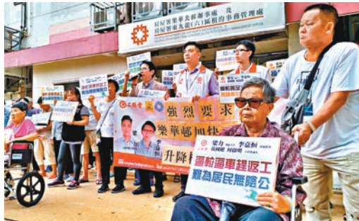
■ 樂華北邨居民遊行，要求房署縮短更換升降機工程時間。

有約35年歷史的樂華北邨正逐批更換升降機，令繼續運作的升降機因而經常滿載。工聯會指工程增加居民等候升降機時間，加上僅餘的升降機不時故障，令居民生活大受影響，該會立法會議員黃國健昨日與約60名居民在邨內遊行，要求房屋署縮短更換升降機施工期，以減低工程對居民影響。