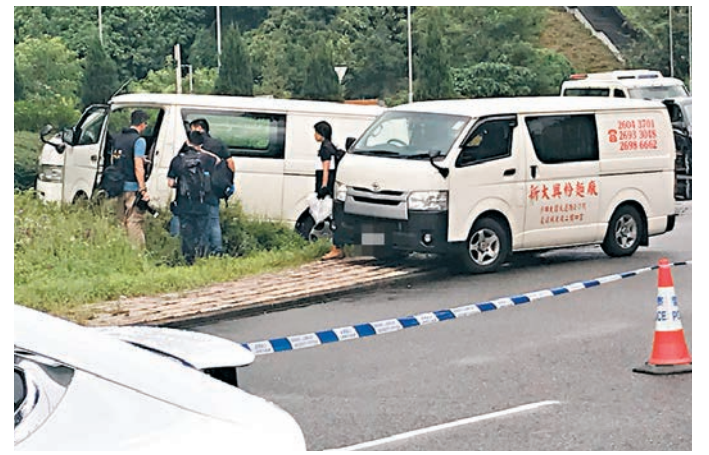
被偷客貨車(左)與麵粉廠男員工駕駛追截的客貨車(右)碰撞後衝入迴旋處草地。

警方呼籲目睹案件或有資料提供人士,致電36613388與警方聯絡,案件目前交由新界北重案第二隊調查。