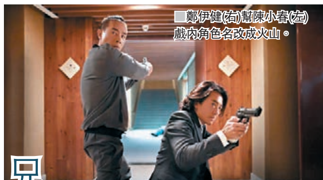
鄭伊健(右)與陳小春(左)戲內角色名改改火山。