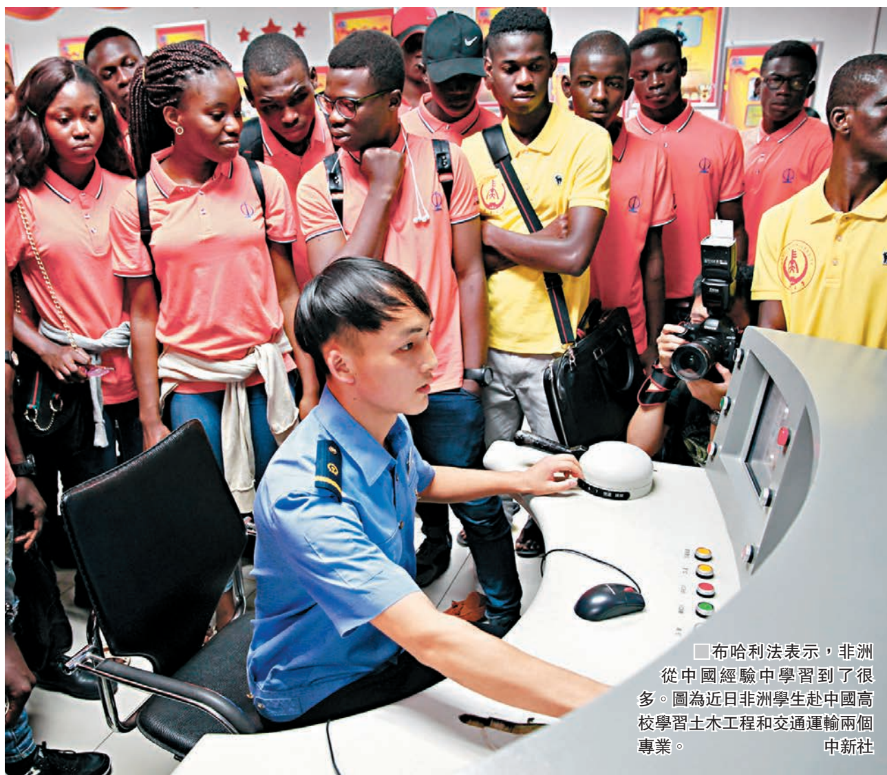
布哈利法表示，非洲從中國經驗中學習到了很多。圖為近日非洲學生赴中國高校學習土木工程和交通運輸兩個專業。

他提及「一帶一路」稱，該倡議在非洲國家響應度很高，同時，由於非洲各國都有自己的發展規劃和戰略方案，再加上聯合國2030年可持續發展議程以及非盟《2063年議程》，因此如何將「一帶一路」倡議和上述多個政策進行對接，顯得尤為重要。他認為，如果能夠成功對接，不僅中國的資金、技術、裝備、人才等優勢能與非洲自然資源、人口紅利、市場潛力等緊密對接，雙方人民的關係也將更加緊密。