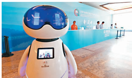
2018年中非合作論壇北京峰會新聞中心開始試運行。