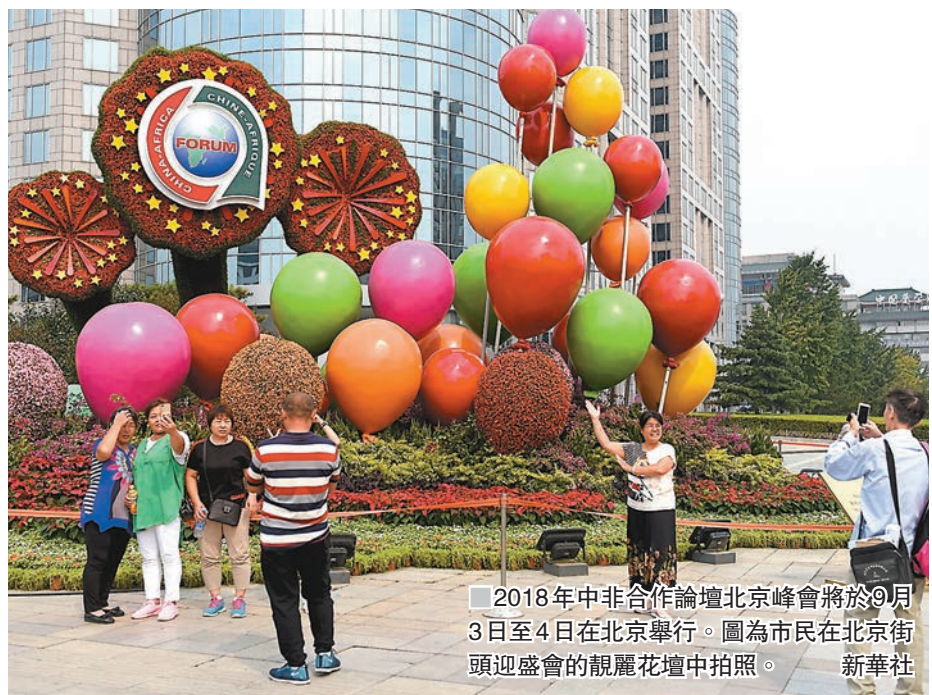
2018年中非合作論壇北京峰會將於9月3日至4日在北京舉行。圖為市民在北京街頭迎盛會的觀禮花壇中拍照。

他強調,中國在非洲的投資,絕大部分形成了基礎設施,對今後的經濟增長將有重大的作用,是有價值的資產。同時,中國也會注意在選擇項目時要多選擇一些經濟效益好、能創造就業、稅收、出口的项目。