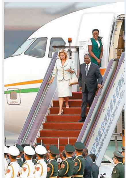
科特迪瓦共和國總統阿拉薩內·瓦塔拉昨日抵達北京。中新社

香港文匯報訊 據新華社報導,中國外交部發言人陸慷昨日宣佈:應中國國家主席習近平邀請,科特迪瓦共和國總統瓦塔拉、塞拉利昂共和國總統比奧、博茨瓦納共和國總統馬西西、布基納法索總統卡博雷將結合出席中非合作論壇北京峰會,於8月28日至9月7日先後對中國進行國事訪問。