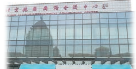
中非合作論壇北京峰會在北京國際飯店建國際會議中心設立新聞中心。

值得一提的是,位於新聞中心三層的媒體公共工作區設有496個工位供記者免費使用,考慮多數非洲國家講法語,其中156個