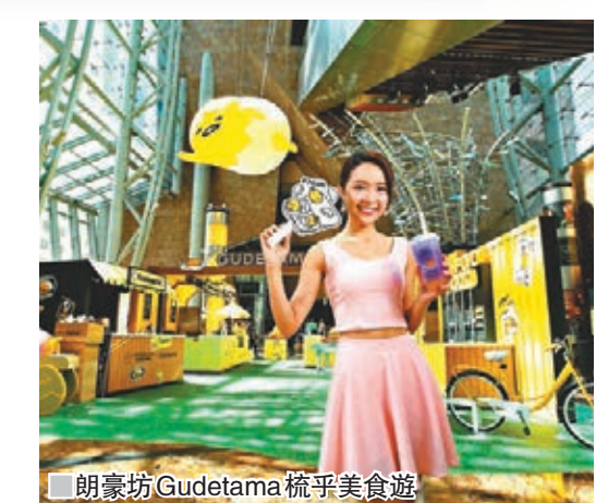
朗豪坊Gudetama梳乎美食遊