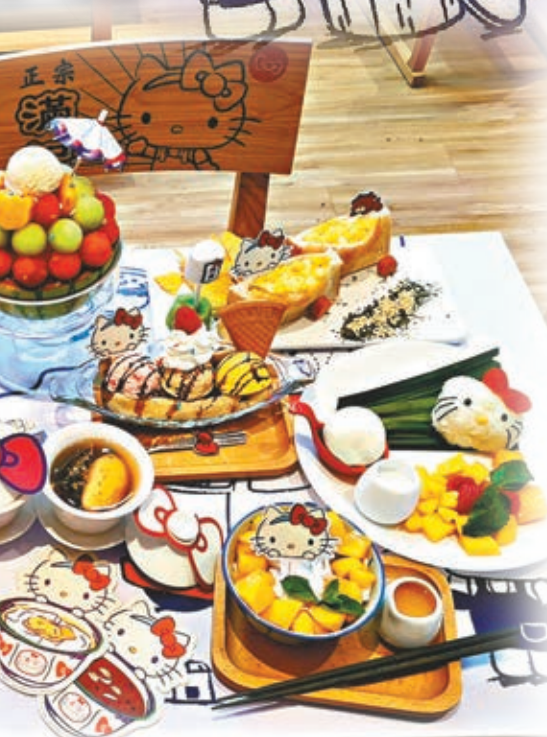
一系列以可愛經典Hello Kitty為主題的自家製甜品