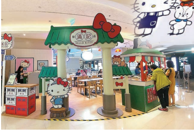
滿記甜品×Hello Kitty「復刻甜品屋」牌坊大門