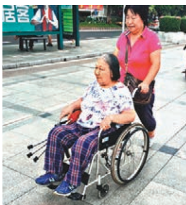
贍養老人壓力普遍存在。