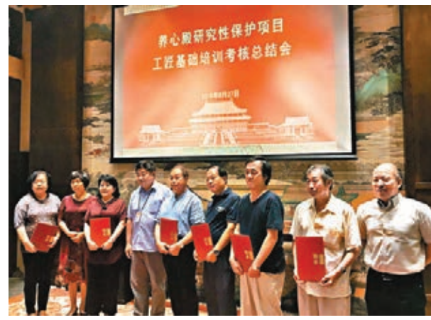
故宮向培訓授課老師頒發聘書。

香港文匯報訊(記者 江鑫燭 北京報道)「閉關」兩年零八個月的故宮養心殿,將於9月正式動工修繕。故宮博物院昨日召開「故宮博物院養心殿研究性保護項目工匠基礎培訓考核總結研討會」宣佈,單霽翔表示,故宮博物院於2016年啟動「養心殿研究性保護項目」,兩年零八個月過去了,修繕尚未真正開工。兩年多來故宮各部門全面介入,事先開展了33項研究課題,目前可以說「萬事俱備」。