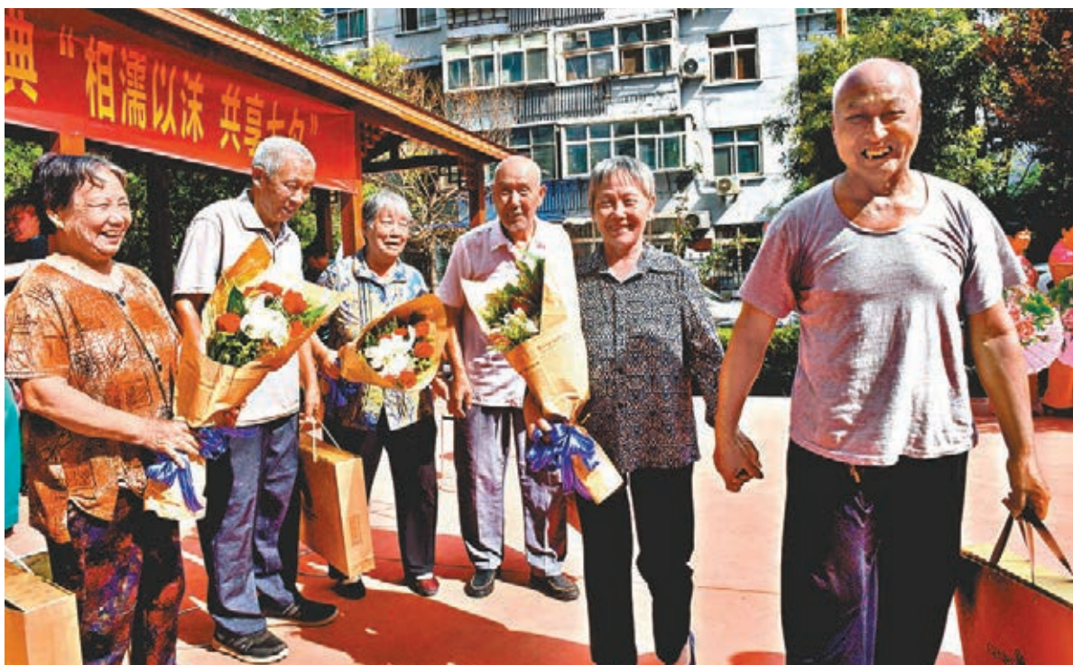
二審稿維持5,000元/月的個稅起徵點,增加贍養老人支出作為扣除專項。圖為8月17日河北邢台市一社區金婚老人在「相濡以沫共享七夕」活動上。

在稅前專項扣除方面,二審稿明確包括子女教育、繼續教育、大病醫療、住房貸款利息或者住房租金、贍養老人等支出。在備受關注的專項附加扣除如何進行問題上,二審稿明確規定具體範圍、標準和實施步驟「由國務院確定,並報全國人民代表大會常務委員會備案。」