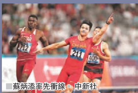
蘇炳添賽後衝線。中新社

昨晚雅加達亞運男子100米跑決賽，中國名將蘇炳添以9秒92成績力壓上屆冠軍奧古奴迪(Tosin Ogunod)摘金，並以0.01秒優勢刷新亞運紀錄。同日國家隊於羽毛球男女單全數8強止步，由於自1974年參賽亞運羽毛球以來每屆都至少有女單選手站上領獎台，因此國羽男女單全數無緣亞運4強，這還是第一次。