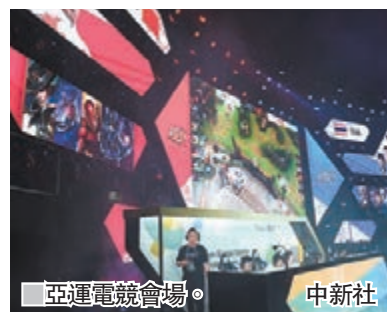
亞運電競會場。

同日，首登亞運舞台的電競表演賽項目昨天開打，六個競賽項目中，打頭陣的是多人在線電競類型的王者榮耀國際版(Arena of Valor)賽事。中國團隊在首戰2:0擊敗泰國隊，及後再戰勝中國台北，取得亞運史上首個電競項目的冠軍。港隊代表則三甲不入。