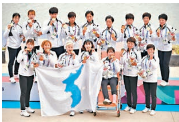
朝韓聯隊獲女子500米龍舟競速冠軍。

註：有線601及661台5:30至8:00直播單車及攀岩賽事。有線602台直播男足8強賽事。