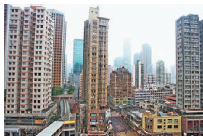
全港達八成升降機的配備未達最新安全裝置水平。