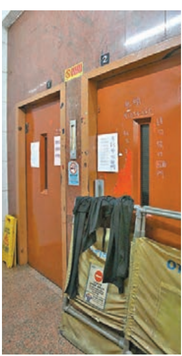
機電署指舊式升降機仍有改善和優化空間。

因此他建議,資助計劃可設追溯期,如合資格大廈已決定更換升降機,就會提供資助,讓業戶安心,盡快處理升降機問題,免除困擾;亦可避免當資助計劃出爐時,升降機公司一時間工作量大增,無法應付。他促請政府盡快公佈資助計劃詳情。