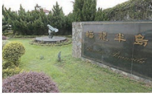
龍龍半島一單位外傭涉放清潔劑入飲品被捕。

警員到場調查後,以涉嫌對所看管兒童或少年人虐待或忽略罪名,拘捕一名39歲的菲律賓籍家傭帶署扣查,案件交由沙田警區刑事調查隊跟進。