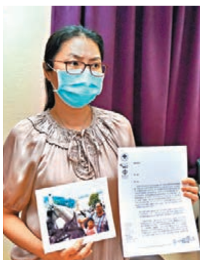
Altbauer遺下兩名年幼女兒。