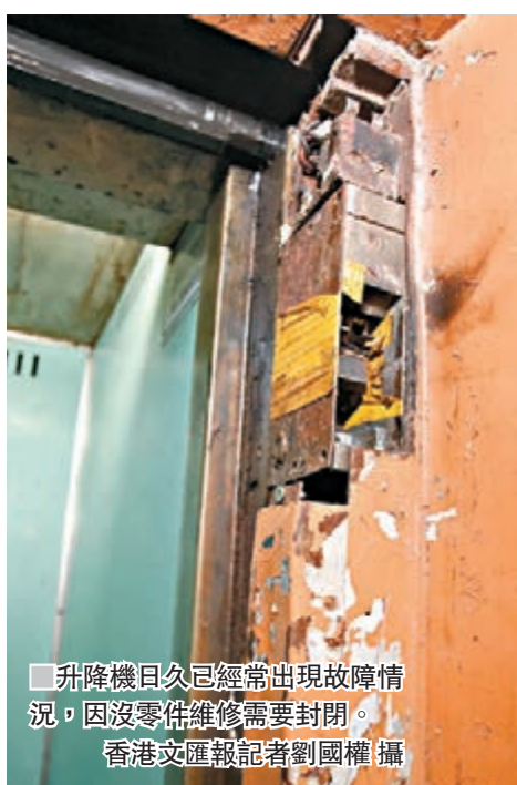
升降機日久已經常出現故障情況,因沒零件維修需要封閉。