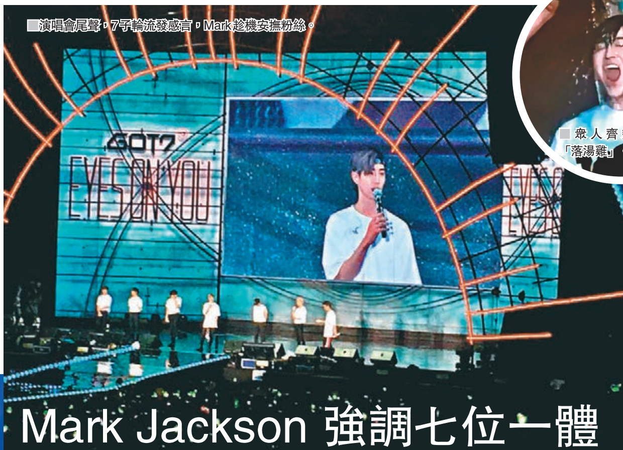
Mark Jackson 強調七位一體

香港文匯報訊(記者梅馨文)韓國人氣男團GOT7前晚假亞博館舉行「GOT7 2018 WORLD TOUR 'EYES ON YOU' IN HONG KONG」,是其今次世巡最後一站,氣氛勁high,尾段更瘋狂潑水,眾人齊變「落湯雞」。香港成員王嘉爾(Jackson)佔有主場之利,歡呼聲最大,又大教其他成員講廣東話。至於成員Mark近日因與JYP的續約問題也成焦點,前日他開腔回應:「沒有7個人都不是GOT7!」