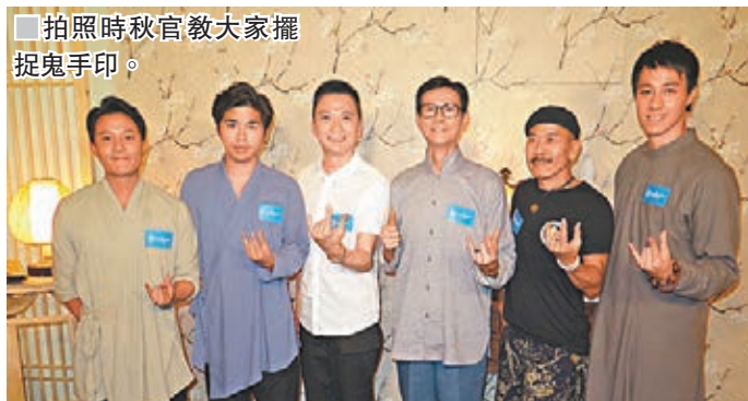
拍照時秋官教大家擺捉鬼手印。

白講是會驚的，但我本着尊敬的心應該沒事，我問過前輩，拍的時候可能要自己一個人，但我反而想有陰陽眼的人同行，讓我可以跟靈體有交