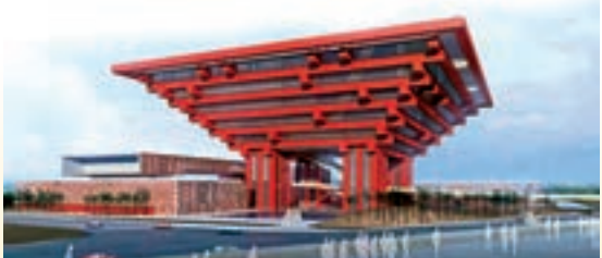
2010年，ROY Ceramics SE被上海世博會的中國館和主題館，指定為唯一衛浴設備供應商。