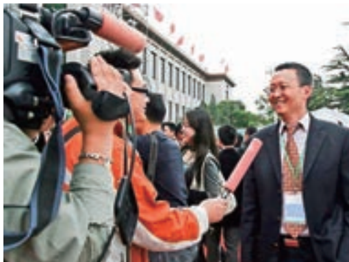
李兆峰博士早年接受央視訪問