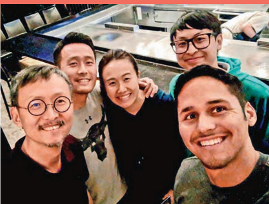
李兆峰博士與家人合照

社會的責任感，更使青年人充分發揮其熱情和創意，更多地投入到社會創新領域。李兆峰博士環顧全球指，世界許多國家和地區在社會創新方面，都非常重視年輕人的作用。他建議年青人認真檢視機會，多參與商界投入的資源平台，及把握粵港澳大灣區的龐大資源，將創意轉化成商品並開拓內地市場。他續說，香港青年應該要加深認識國家，把自己個人夢想的香港夢和國家民族的中國夢結合在一起，通過粵港澳大灣區的機遇融入國家發展大局，相信隨着廣深港高鐵通車，港人能更容易來往大灣區內的城市，獲得包括工作在內的、更龐大的發展機遇。