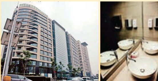
北京永泰福朋喜來登酒店式公寓選用ROY Ceramics SE智能馬桶等陶瓷潔具工程項目工程項目。