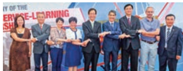
鄧竟成代表香港航空出席活動

好學不倦、積極上進的鄧竟成，於2000年修讀為期兩年的香港大學社會科學院國際關係學碩士學位，並於兩年後獲晉升為警務處高級助理處長(行動)。翌年，鄧竟成再獲晉升為警務處處長(行動)。