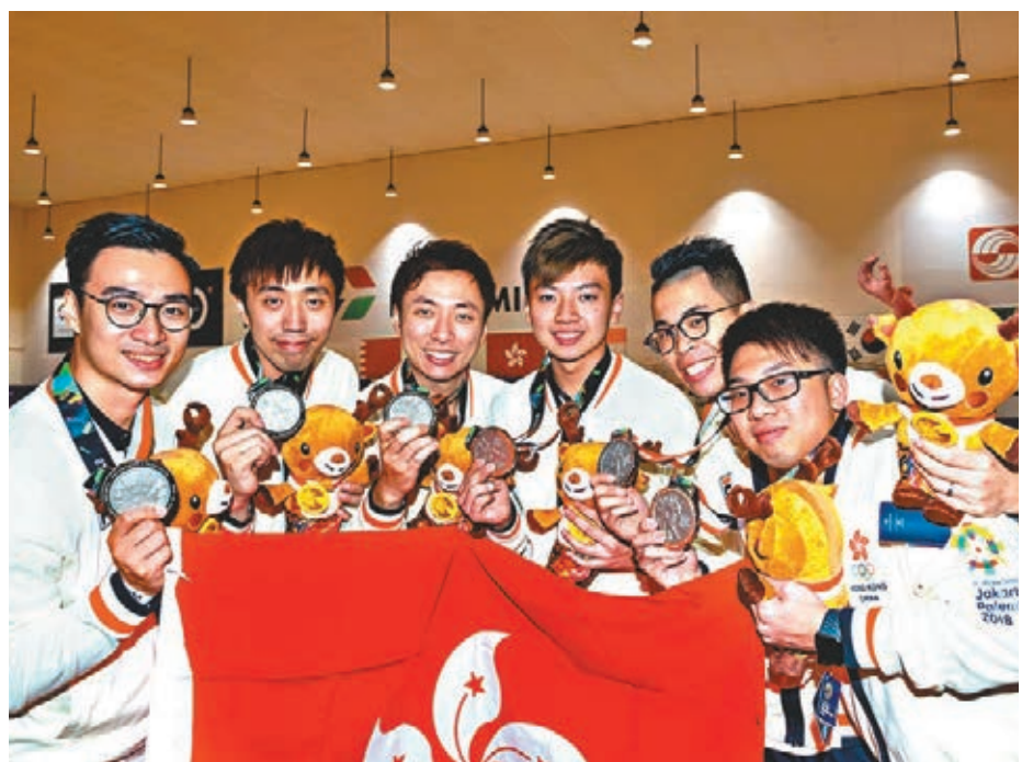
香港保齡球隊奪得男子六人隊際賽銀牌。