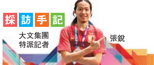
大文集團特派記者 張銳

探訪手記 不知不覺，記者採訪印尼雅加達亞運會的日子已經過半，這十多天裡收穫了歡樂、收穫了友誼、收穫了知識、也收穫了經歷。前天(24日)則是收穫了意想不到的驚喜，記者在傳媒中心工作時，居然偶遇了不久前才打破女子50米背泳世界紀錄的亞運金牌選手、中國隊的「女神」劉湘！與不少人一樣，記者也是在前幾天才認識這名年僅21歲的泳手。前天晚上，記者正在傳媒中心工作，突然眼神伶俐地看見一名酷似劉湘背影的中國隊選手，記者馬上意識到這是一個絕對不能錯過的機會，上前追問後，果然是劉湘本人！那一瞬間，記者興奮得猶如心裡有隻小鹿亂撞般，馬上自報家門說自己是來自香港大公文匯集團的特派記者，並向劉湘詢問她什麼時候能來香港比賽，因為香港有很多像記者本人一樣的粉絲，她微笑地說有機會一定會來。隨後，記者趁劉湘馬上需要趕車離開前和她做了個簡短的訪問，以下便是劉湘親述的內容：「這次亞運會有一半是開心，因為打破了世界紀錄，另一半不開心的原因是50米自由式僅得銀牌，希望東京奧運會能夠在50米背泳項目站上領獎台。現在會有短時間的休假，但不會太久，回到家第一件事要做的就是陪陪很少見面的爸爸媽媽。」劉湘真人親切和藹，毫無架子，態度謙遜，猶如鄰家女孩，卻不經意間成為了中國游泳隊中有顏值和實力的運動員，記者非常期待和劉湘的下次相遇。