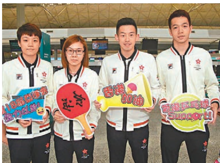
香港乒隊誓言全力以赴。

雅加達亞運會乒乓球團體小組賽分組形勢昨日揭曉，兩項團體冠軍將於28日產生。港女隊與新加坡、馬來西亞、越南及尼泊爾同處D組；而男隊被分在C組，同組對手有韓國、印度、蒙古及也門。港隊總教練陳江華表示，女隊運籌正常，男隊形勢則比較艱難，「與韓國同組，我們處下風，所以我們需擺正心態放下包袱全力以赴，希望創下奇跡。」至於國家女乒與印度、伊朗和卡塔爾隊被分在A組。男團方面，A組的國乒與朝鮮、馬來西亞、尼泊爾和老撾隊同組。帶着為2020年東京奧運會選拔培養隊員的目的，國乒派出年輕陣容參加本屆亞運會，多數隊員沒有大型綜合性運動會的參賽經驗。男隊方面，由樊振東帶領林高遠、王楚欽、梁靖崑和薛飛四人參賽，女隊由朱雨玲領銜，其他隊員為陳夢、王曼昱、陳幸同和孫穎莎。國乒女隊的主要對手為日本、韓國與中國香