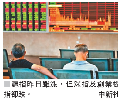
滬指昨日雖漲,但深指及創業板指卻跌。

香港文匯報訊(記者 章蘿蘭 上海報導)央行開展中期借貸便利(MLF)操作1,490億元(人民幣,下同),加強貨幣政策與財政政策協調配合,維護銀行體系流動性合理充裕,A股銀行股昨日發威,整體大漲2.5%,上證綜指收市亦微漲0.18%,全周累升2.27%。