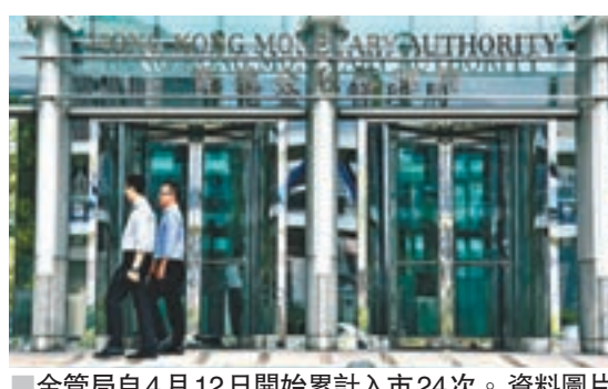
金管局自4月12日開始累計入市24次。資料圖片

事實上,金管局上周一連兩日4度出手承接港幣沽盤,令本港銀行體系結餘終失守千億元水平。金管局總裁陳德霖等高層連日為入市護航,強調本港過去多年有約1萬億港元資金大量流入,現時資金流出港幣是港幣正常化的必經過程,重申金管局