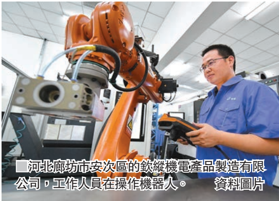
河北廊坊市安次區的致縱機電產品製造有限公司，工作人員在操作機器人。資料圖片

國家發改委在同一場合還表示，下一步，將加速培育發展戰略性新興產業，加速構建國家創新體系，圍繞突破核心關鍵技術啟動建設一批國家產業創新中心；並着力打造北京、上海、粵港澳大灣區三個具有全球影響力的科技創新中心，加快推進北京懷柔、上海張江、安徽合肥三個綜合性的國家科學中心，要增強原始創新能力。