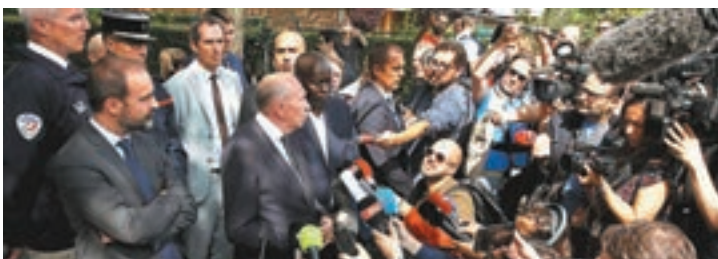
科隆事後會見大批傳媒。