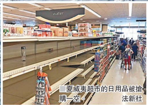
夏威夷超市的日用品被搶購一空。