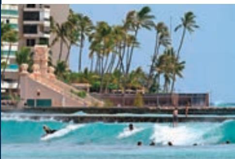
民眾乘風高浪急滑浪。