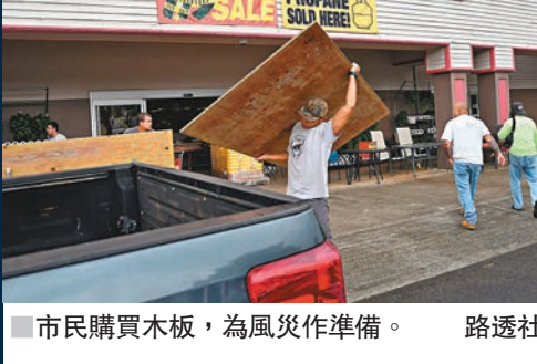
市民購買木板，為風災作準備。

提起出現於太平洋的熱帶氣旋，一般都會聯想到香港常見的太平洋颶風，但原來「颶風」只是對形成於國際換日線以西的強力熱帶氣旋的統稱，至於太平洋東部形成的強力氣旋，氣象學上一般稱為「太平洋颶風」(與大西洋形成的颶風作區別)。太平洋颶風非常罕見，平均每年只有4至5個，當中正面吹襲夏威夷的更是少之又少，專家表示，「萊恩」今次吹襲夏威夷既有遠因亦有近因，近因是夏威夷周邊氣壓情況有變，遠因則是全球暖化導致夏威夷周邊海水升溫，為「萊恩」提供接近夏威夷的誘因。