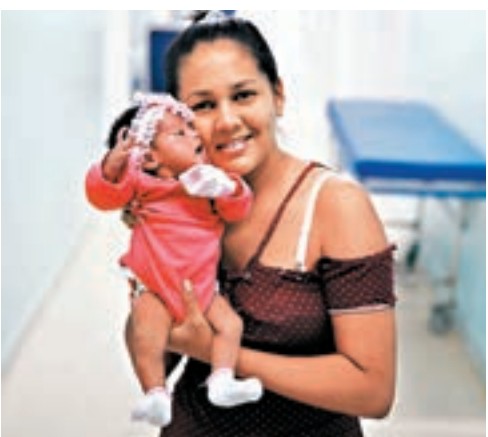
不少委人前往巴西生育。

蘇里塔稱，博阿維斯塔現時有3,000名無家可歸及未曾接種疫苗的委國難民，令巴西早已根絕的麻疹疫症再度爆發。