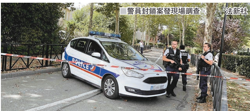
警員封鎖案發現場調查。

法國巴黎市郊的特拉普鎮昨日發生懷疑恐襲，一名36歲男子在家中持刀刺死母親後，再衝出屋外殺死其一名姊妹，另有一名女子遇襲重傷。警員到場後，疑兇持刀衝前，遭警員開槍擊斃。極端組織「伊斯蘭國」(ISIS)承認疑兇是該組織成員，響應號召施襲。法國內政部長科隆則稱，疑兇有嚴重精神問題，事件與恐怖主義無關。