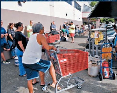
夏威夷人急急購買燃料。