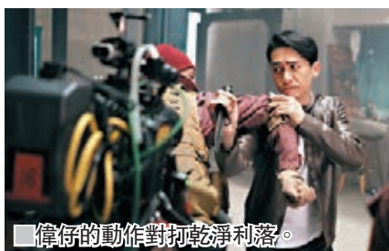
偉仔的動作對打乾淨利落。

而打造出「經典港式風格」動作設計的正是成家班王牌動作指導韓冠華。這位金像獎、金馬獎「最佳動作設計」團隊成員，更帶領成家班成員提前幾個月開始研究劇本，從人物和劇情出發，進行動作場面的構思和創意，並在開拍前對演員進行了為期2個月的動作集訓，用高強度的對打訓練，鍛煉演員的動作反應及動作細節。