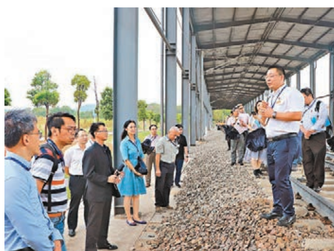
工聯會香港鐵路工會聯合會日前組團前往武漢，親身體驗高鐵路帶來的巨大變化。