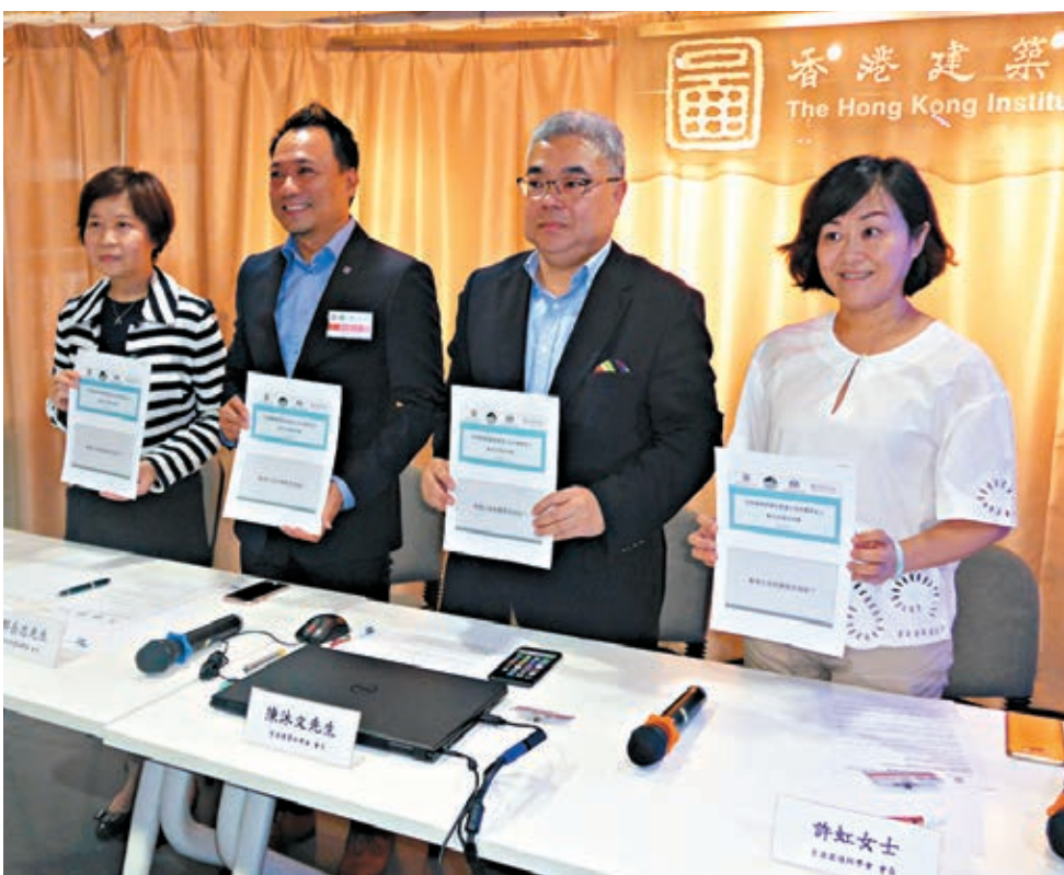
四個專業學會建議政府應以建設宜居城市為目標，審慎考慮每個土地選項，並建立土地儲備，應付長期土地需求。香港文匯報記者岑志剛攝