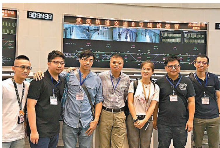
「互聯網+軌道交通質量控制系統」，令團友大開眼界。

聯合會昨日對香港文匯報表示，當高鐵路香港段開通，港人可早上乘搭高鐵路從西九龍站出發，中午在珠三角城市用午餐，享受一小時生活圈的便利快捷，千重山萬丈水都不再是障礙。作為鐵路從業員，團友們均為自己身處國家鐵路及城軌大發展的大時代中感到自豪。