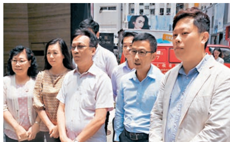
文裕明引述黃傑龍稱，未補價分租屋計劃將接受合資格的單身人士申請。

香港文匯報訊（記者 岑志剛）房協計劃在第三季推出計劃，容許轄下未補地價的資助房屋單位分租予公屋候冊人士。公屋聯會昨日與房協行政總裁黃傑龍會面後表示，房協擬容許業主將單位出租予輪候公屋3年或以上人士，合資格的單身人士亦可申請，但家庭申請會有優先權。