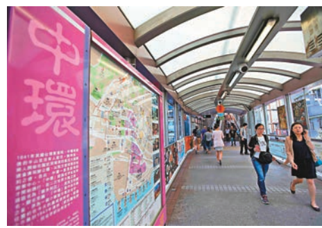
中環連廊四通八達。

香港獨特的地理位置和制度優勢，在國家粵港澳大灣區和「一帶一路」建設中具有重要的地位。如果我們借用「連廊」的概念，香港又何嘗不是「粵港澳連廊」和「一帶一路連廊」的一個重要支點？香港