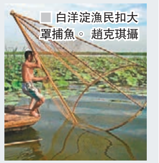
白洋淀漁民扣大網捕魚。

了多元的生物鏈和特色經濟文化。」 恢復白洋淀生態 推內河航運旅遊 冬子李說：「孫犁筆下的蘆葦蕩和荷花淀，無不令人神往。但白洋淀也曾遭遇乾涸、污染的威脅。引黃濟淀，去年已試水成功。不過，白洋淀生態恢復，根本在於上通九河，下通渤海，形成河海湖自然循環生態體系。」 其實，早在幾年前，河北保定就出臺了「保津內河航運旅遊規劃」，這個地方版的規劃，正在升級為國家戰略項目，納入雄安新區建設的大格局。