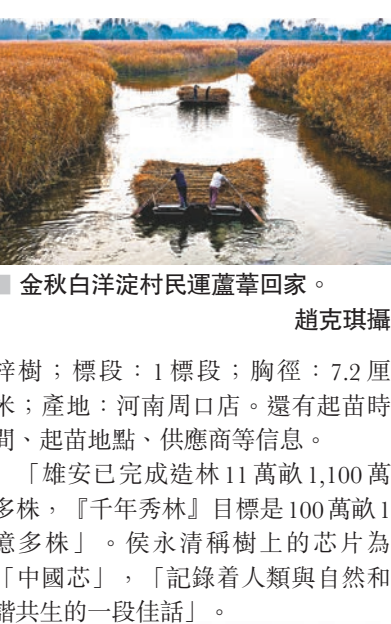
■ 金秋白洋淀村民運蘆葦回家。

壽命要高5到10倍，但是，實生苗成林慢。『雄安質量』第一次在中國城鎮史上被明確地提出來，造林也是一樣，不僅要看100年，還要看1,000年。『千年秀林』全部選用實生苗，而且選用優質樹種，比如銀杏、海棠、櫻花、板栗、杜仲、白皮松等近百個品類。」侯永清說：「造林之初，我們就營造一種異齡、復層、混交、多樹種的生態結構，經過10到20年地培育，林地會形成一個近自然的生態系統。在非人力干擾的情況下，不斷有種子落地和新芽萌生。」 樹木掛二維碼 記錄共生佳話 在「千年秀林」九號塊區，一片梓樹林長出新枝。記者用手機隨機掃描樹幹上的二維碼，信息顯示：樹種：