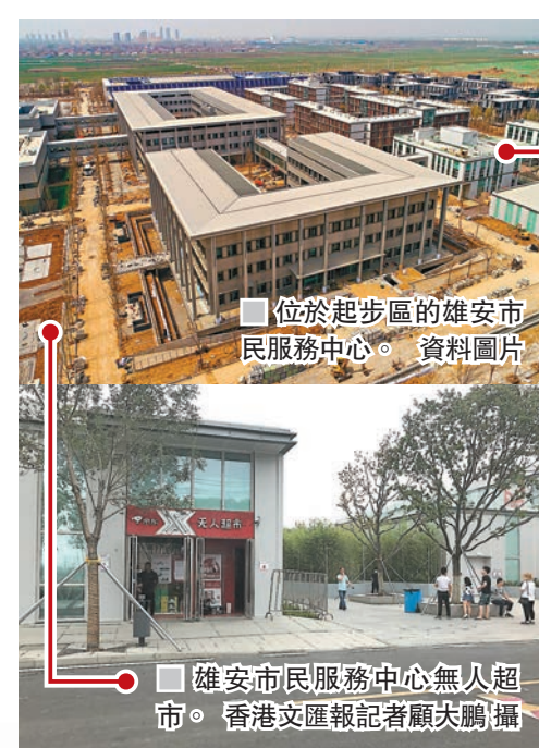
位於起步區的雄安市民服務中心。

領導人寄語 「雄安新區將是我們留給子孫後代的歷史遺產，必須堅持『世界眼光、國際標準、中國特色、高點定位』理念，努力打造貫徹新發展理念的創新發展示範區。」 ——習近平2017年2月