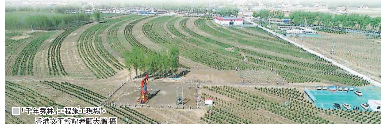
「千年秀林」正工程施工現場。