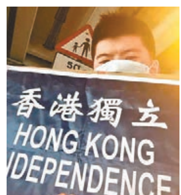
陸海天曾在自己的fb上展示「港獨」標語。