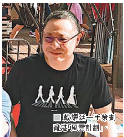
戴耀廷一手策劃「風雲計劃」。

本月中旬，「香港民族黨」召集人陳浩天在外國記者會(FCC)「宣獨」時，錢寶芬更帶領一眾鳩鳴團成員在場外聲援陳浩天。香港文匯報記者當時所見，演講開始前，錢寶芬等人企圖突破警方防線，故意製造衝突場面，其間有人更不停辱罵執勤警員，現場一度十分混