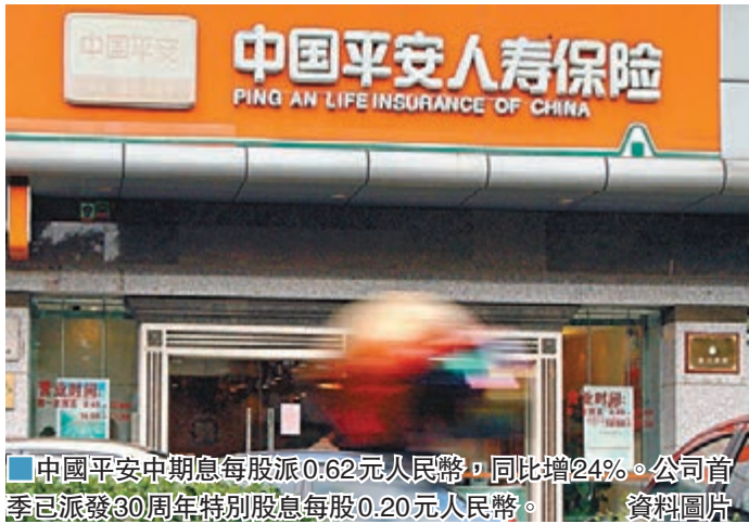
中國平安中期每股派0.62元人民幣，同比增24%。公司首季已派發30周年特別股息每股0.20元人民幣。

香港文匯報訊 中國平安保險(2318)昨公佈2018年中期業績，上半年歸屬於母公司股東的淨利潤580.95億元(人民幣，下同)，同比增33.8%；若按保險子公司執行修訂前的金融工具會計準則的法定財務報表利潤數據計算，公司實現歸屬於母公司股東的淨利潤624.05億元，同比增43.7%。中期息每股派0.62元，同