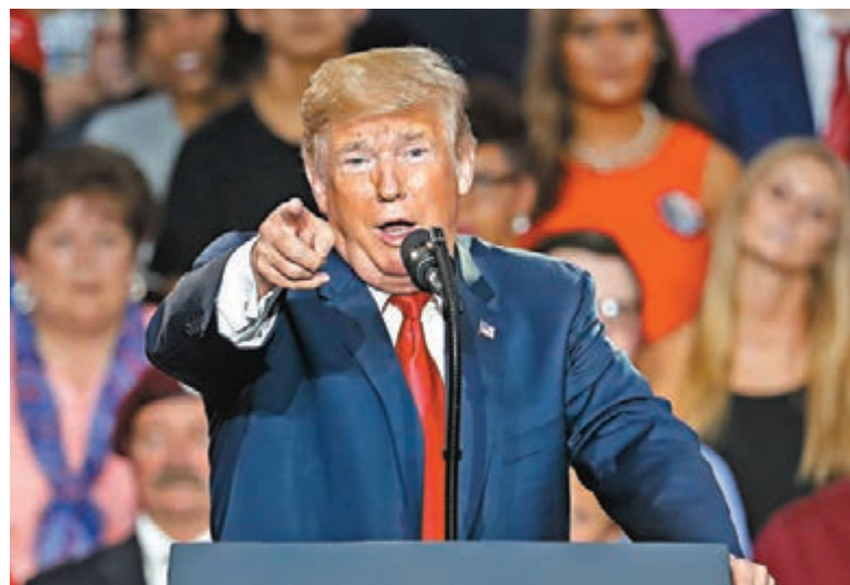
特朗普表示，他不滿鮑威爾的升息舉措，並稱美聯儲應做更多努力協助他提振經濟。