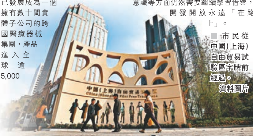
市民從中國(上海)自由貿易試驗區字牌前經過。 資料圖片

胡煒特別提到，香港資本市場的國際化平台，對中國企業走出去起到重要作用。他舉例說，張江「微創醫療」20年前由海歸博士創立，2010年通過在港上市成為港資企業，目前已發展成為一個擁有數十間實體子公司的跨國醫療器械集團，產品進入全球逾5,000家醫院。 撫今追昔，以港為師起步的浦東和上海，是否已經達到了當年鄧公的期許，成為「內地的香港」？ 「沒有。」在趙啟正看來，香港在市場經濟運行方面還有很多可以學，特別是自由港的建設：「自由港不是簡單的一句話。」胡煒則認為，香港的現代服務業、投資環境建設、法律意識等方面仍然需要繼續學習借鑒，開發開放永遠「在路上」。 市民從中國(上海)自由貿易試驗區字牌前經過。 資料圖片