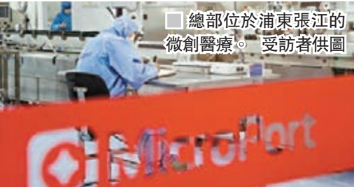
總部位於浦東張江的微創醫療。