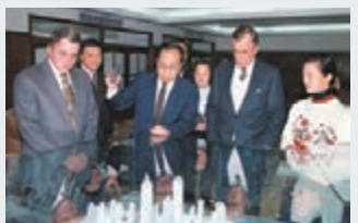
老布什訪問上海，趙啟正拿着激光筆為他介紹浦東的規劃。

望。1993年12月13日，89歲高齡的鄧小平冒雨視察浦東新區，並登上楊浦大橋眺望說：「喜看今日路，勝讀十年書。」 老布什讚發展 年輕點必投資 1994年，時任美國總統老布什到訪浦東，在浦東規劃模型前，趙啟正手中的激光筆引起了他的注意：「這是高科技，我見過，鮑威爾當時向我匯報海灣戰爭時就用這個。」趙啟正則回答：「我和鮑威爾有一點區別，他的激光打到哪裡，哪裡炸平了；我的激光筆點到哪裡，哪裡成長起來。」老布什點頭稱是，還曾感慨「如果我再年輕一點，一定來浦東投資」。