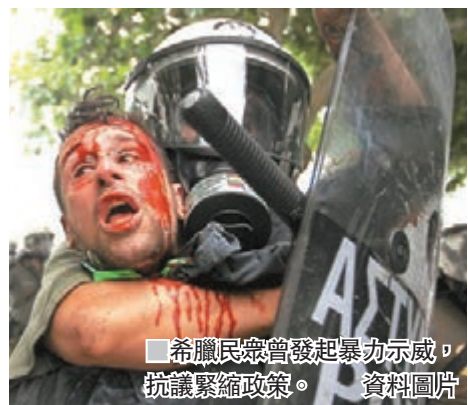
希臘民眾曾發起暴力示威，抗議緊縮政策。資料圖片

希臘於2009年爆發債務危機，並先後於2010年、2012年及2015年，向歐盟、歐洲央行和國際貨幣基金組織(IMF)「三巨頭」申請3輪共2,890億歐元(約2.6萬億港元)