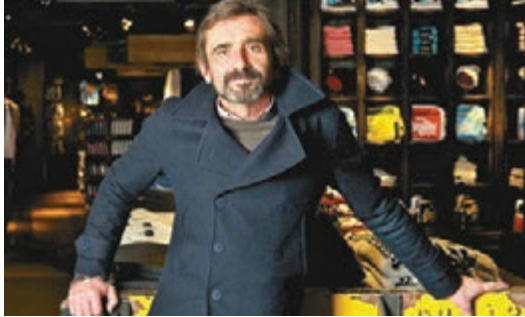
著名潮牌Superdry創辦人之一鄧克頓希望英國留歐。