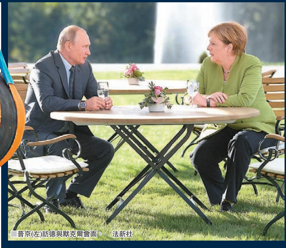
普京(左)訪德與默克爾會面。