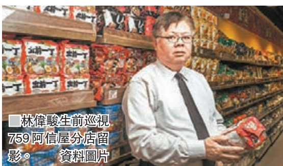
■林偉駿生前巡視759阿信屋分店留影。資料圖片

香港文匯報訊(記者 杜法祖)「759阿信屋」母企CEC國際(0759)昨日公佈,創辦人兼主席林偉駿前日(18日)在養和醫院逝世,享年61歲。公告未透露林偉駿的離世原因,但稱董事會將盡力按已故主席訂立的策略繼續經營集團之業務。董事會將重組公司架構,並適時刊發進一步公告。