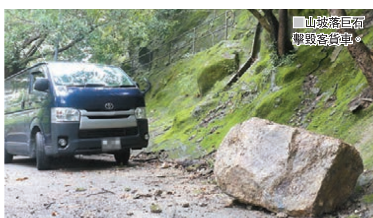
■山坡落巨石 壓毀客貨車。

香港文匯報訊(記者 蕭景源)黃大仙沙田坳道法藏寺對上約200米山坡路邊。昨日上午11時許,一名姓陳(49歲)男司機到上址取車,赫然發現其在前晚11時許停泊上址的客貨車,左邊車身被一塊約1米乘1米大,重約一噸的大石壓毀凹陷,車門亦告毀爛。由於昨日凌晨曾有連場大雨,天文台更在清晨6時25分發出黃色暴雨警告信號長達2小時50分鐘,至早上9時15分才取消,陳相信大石是在黃雨期間由山坡上滾下,幸無釀成傷亡,於是報警。