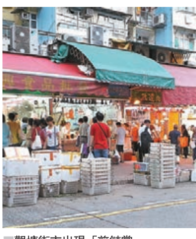
■觀塘街市出現「剪鏈黨」。

另在樂富街市及長沙灣保安道街市,當年的4月及10月均有「剪鏈黨」在犯案時失手落網。據悉「剪鏈黨」多以兩三人一組,分工合作犯