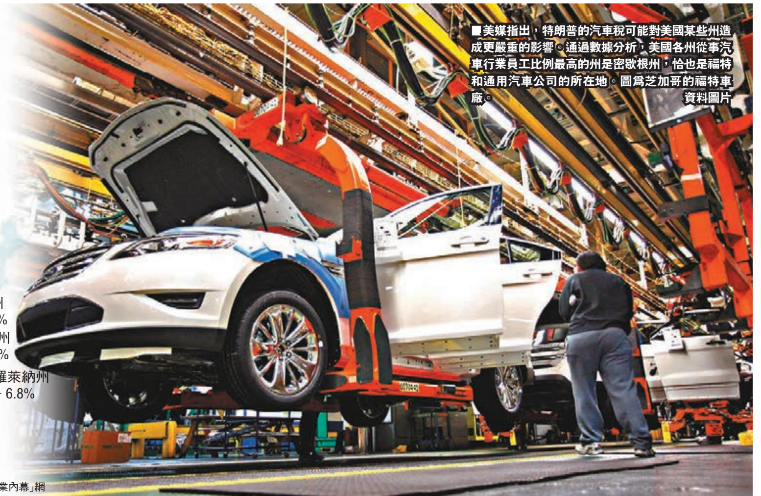
美媒指出，特朗普的汽車稅可能對美國某些州造成更嚴重的影響。通過數據分析，美國各州從事汽車行業員工比例最高的州是密歇根州，恰也是福特和通用汽車公司的所在地。圖為芝加哥的福特車廠。資料圖片

香港文匯報訊 美國總統特朗普自五月份以來，以「威脅國家安全」為由執意要向進口汽車和零部件徵收25%關稅。環球網引述美國媒體「商業內幕」網站昨日發表文章分析稱，特朗普的徵稅行為不僅給美國部分州帶來重創，而且還可能給其本人帶來政治風險。