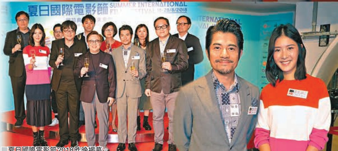
夏日國際電影節2018昨晚揭幕。