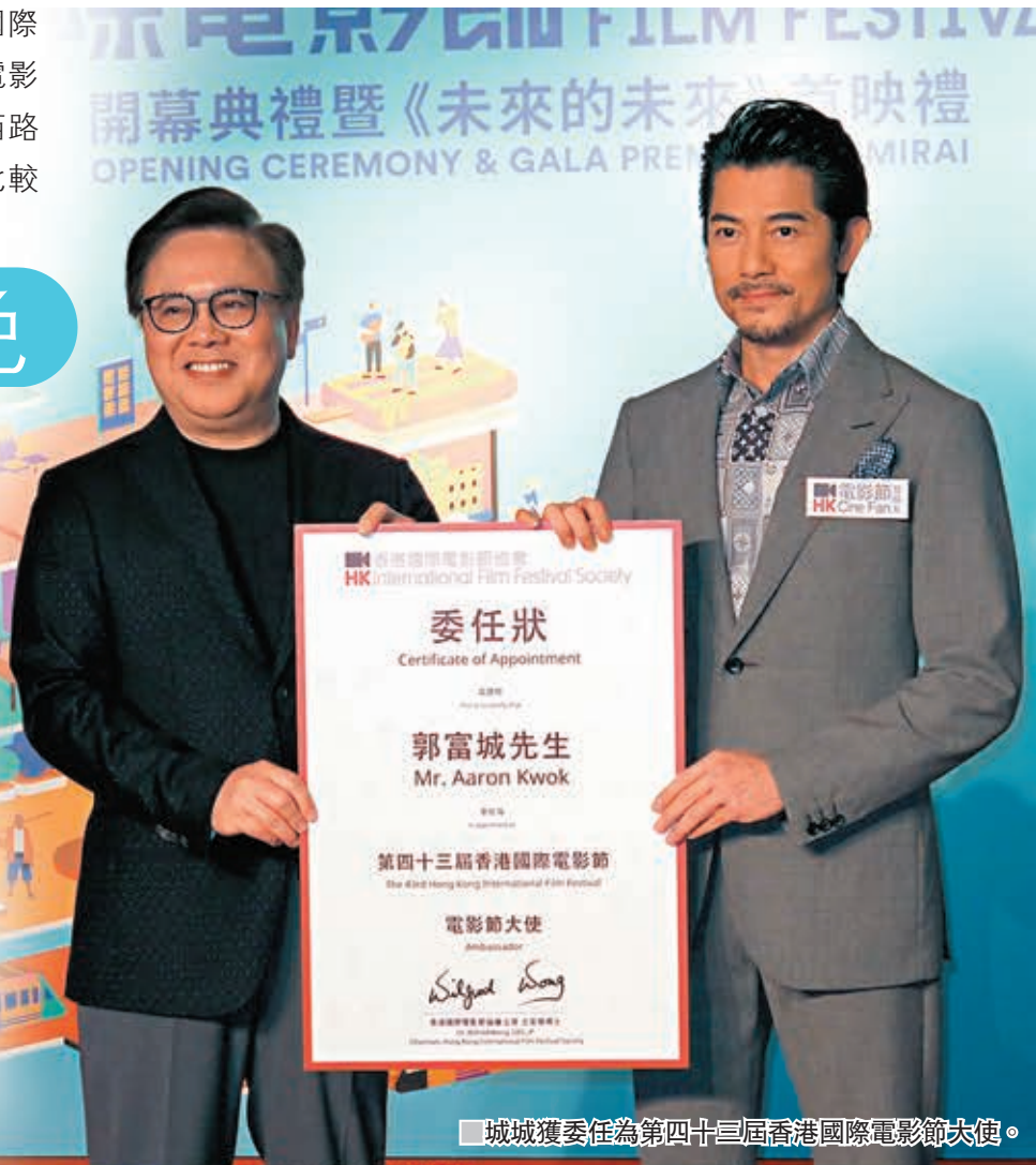
城城獲委任為第四十三屆香港國際電影節大使。

另外談到他的IG被冒認,城城回應指由於11月準備世界巡迴演唱會,便有不法之徒魚目混珠,盜用他的照片及開出近似他名字的IG來行騙有演唱會門票發售,故他已透過公司並於網絡上公佈及呼籲想演唱會的歌迷不要受騙,演唱會門票只有經其公司及主辦單位發售,其他地方一概不可能買到,希望大家不要上當,城城說:「好彩及早發現,未有粉絲被騙,現在行騙的手法層出不窮,大家要自我警惕!」