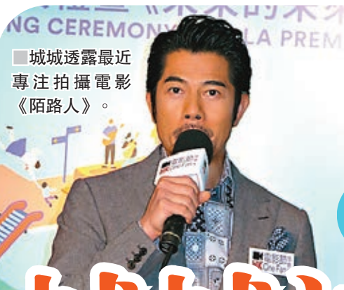
城城透露最近專注拍攝電影《陌路人》。

香港文匯報訊(記者李慶全)夏日國際電影節2018昨晚揭幕,香港國際電影節協會主席王英偉博士聯同日本動畫大師細田守、第43屆香港國際電影節大使郭富城、青年大使余香凝出席開幕儀式。城城透露最近拍電影《陌路人》,今次他主要是支持香港本土電影製作,扶助新導演,而由於角色比較沉重,太入戲的他即使回到家中也和家人問到「你諗緊咩?」