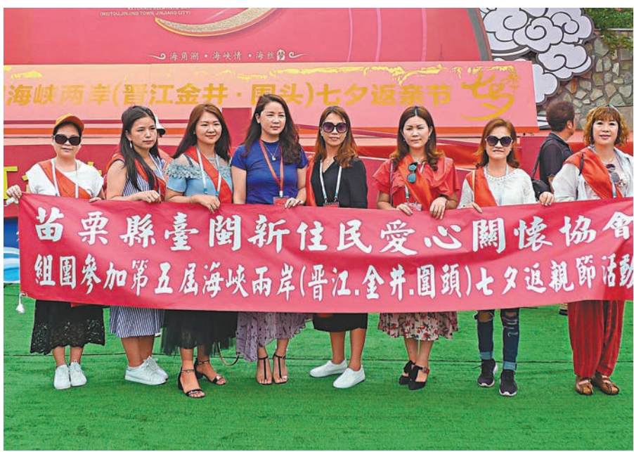
昨日，第五屆海峽兩岸七夕返親節在福建省晉江市圍頭村舉行，嫁台新娘齊齊返鄉度七夕。

據悉，此次返親節還將陸續舉辦兩岸親子嘉年華、閩台基層鄉村發展交流會、兩岸徒步嘉年華以及兩岸學子青年文化交流夏令營等豐富多彩活動。