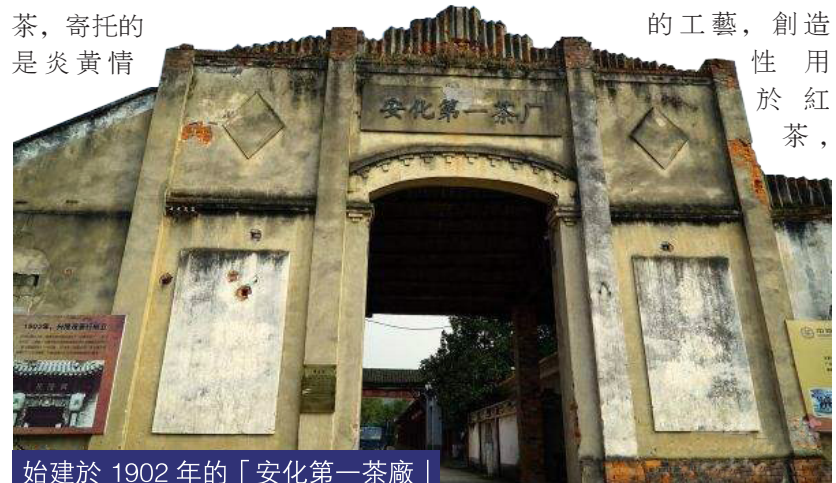
始建於 1902 年的「安化第一茶廠」