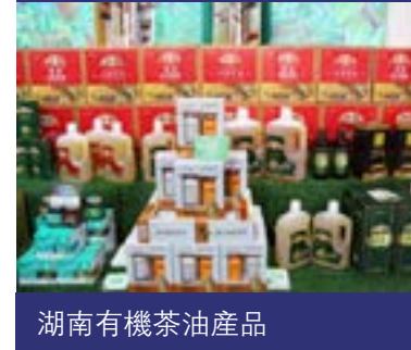
湖南有機茶油產品