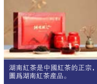
湖南紅茶是中國紅茶的正宗，圖為湖南紅茶產品。