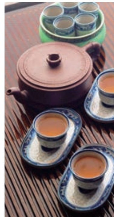
安化黑茶，茶色紅亮，品味甘醇。

客到茶烟起，茶濃情更濃。熱忱歡迎各位嘉賓蒞臨湖南，看看風景如畫的秀美茶園，感受特色農業建設的生動場面，為推進湖南產業興旺、鄉村振興提供更多支持和幫助。