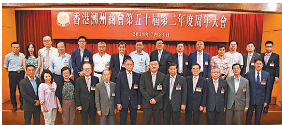
香港潮州商會舉行第五十屆第二年度會員大會,賓主合影。