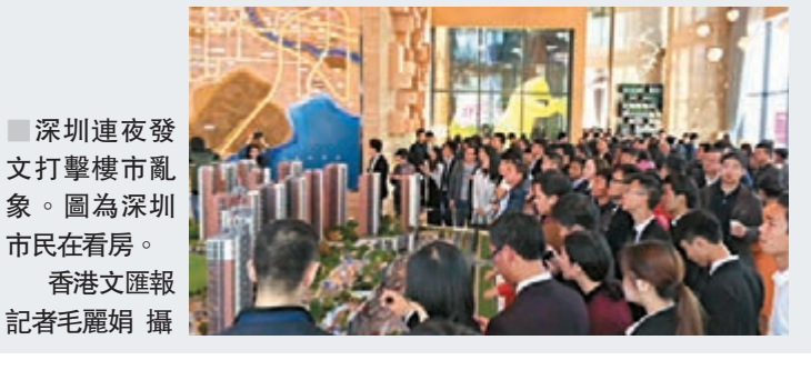
深圳連夜發文打擊樓市亂象。圖為深圳市民在看房。

根據該《方案》，深圳十部門重點打擊四大現象，分別是：投機炒房行為、房地產開發企業違法違規行為、房地產中介機構違法違規行為及房地產虛假廣告。其中包括壟斷房源、操縱房價、房租；捏造散佈房地產虛假信息等方式惡意炒作、哄抬房價；通過更改預售合同、變更購房人等