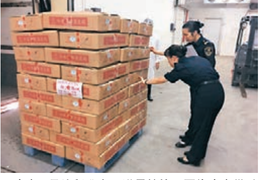
廣東7月外貿進出口增長較快。圖為廣東供香港生鮮正準備出發。

貿易趨於平衡，7月以來，回暖明顯，進出口實現較快增長。數據顯示，單7月份，進出口6,398億元，增長13.7%，出口3,757.5億元，增長5.6%，進口2,640.5億元，增長27.6%。今年前7月，廣東實現貿易順差6,849.5億元，比去年同期收窄26.9%。據介紹，今年以來，一般貿易佔比不斷提升，總金額達到1.87萬億元，增長超過一成，佔廣東外貿進出口接近五成。在出口企業類型方面，前7月，民營企業出口佔廣東總量的48.3%，較去年提升2.8個百分點。主要貿易對象方面，除香港微降0.5%外，其他均保持增長。其中，對美國進出口4,701億元，增長0.8%；對歐盟進出口4,330.3億元，增長0.5%。此外，與「一帶一路」沿線國家進出口8,654.4億元，增長3.5%，繼續保持增長趨勢。