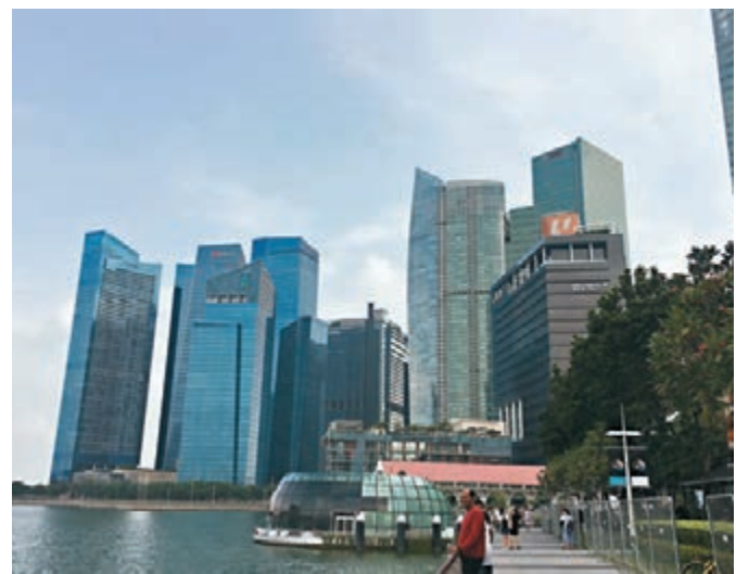
圖為新加坡金融區。

根據過去經驗,在新興市場匯率大幅下跌後,(此處採下跌超過8%後,與年初至今新興市場匯率跌幅相若)開始分批投資持續3年,新興市場表現比全球股市更佳,而且新興國家中,東盟國家表現最為突出,且在這些期間內皆為正回。