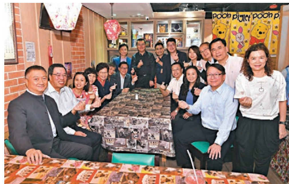
特首辦主任在「喜樂餐飲教室」包場請客。

員,佢曾經接受傳媒訪問時坦言,自己為咗照顧患有自閉症和輕度弱智嘅女兒而辭去工作,但當女兒只得半歲大時,同樣做懲教人員嘅丈夫不幸病逝,她一個人帶大女兒,做過保險、超市收銀、電話傳銷等,2011年用積蓄開第一間餐廳,到今年已先後開過3間餐廳。但開餐廳,唔單止係訓練自己兒有生活技能,將來可以養活自己,同時亦聘請其他智障及自閉人士,當係幫埋其他人。不過,佢之前兩間餐廳都因為蝕本而結業,現在開社企「喜樂餐飲教室」,但生意就唔係好。雖然佢自己每個月都唔攞人工,但每月仍然虧損1萬元。雖然生意唔好,但佢都繼續幫人。上個月,佢就推出午市20蚊外賣自取飯盒,如自備餐具和餐盒可以再減兩蚊,希望幫打工仔慳錢。