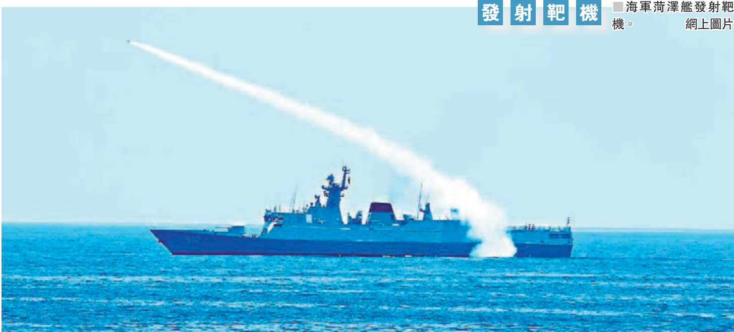
發射靶機 海軍荷澤艦發射靶機。

據報道,3個戰區海軍的10餘艘艦艇同時在台競技,在近似實戰的環境下接受全方位檢驗和考核。據悉,此次競賽性考核,重點考察某型水面艦艇的反導能力,選取世界主流水平的反艦導彈作為靶彈,對多目標進行連續抗擊。考核要求參賽艦艇自主發現、攔截來襲目標,並自行判斷抗擊效果,組織再次攔截。一條條貼近實戰的考核規