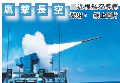
鷹擊長空 近程艦空導彈發射。網上圖片

香港文匯報訊(記者馬靜北京報道)據《解放軍報》報道,來自3個戰區海軍的10餘艘艦艇日前在東海舉行海軍導彈專業實際使用武器競賽性考核,專項研練防空反導課題。對此,軍事專家向香港文匯報表示,防空反導將成為海軍重要訓練科目,藉此將中國反導能力從現有的以陸基反導為主向海基反導延伸,令中國反導能力提升到一個新的層次。該專家指出,未來,海軍將充當中國防空反導的先鋒和主力軍。