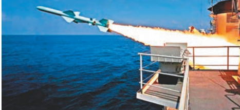
發射導彈 防空導彈發射。

據報道,3個戰區海軍的10餘艘艦艇同時在台競技,在近似實戰的環境下接受全方位檢驗和考核。據悉,此次競賽性考核,重點考察某型水面艦艇的反導能力,選取世界主流水平的反艦導彈作為靶彈,對多目標進行連續抗擊。考核要求參賽艦艇自主發現、攔截來襲目標,並自行判斷抗擊效果,組織再次攔截。一條條貼近實戰的考核規