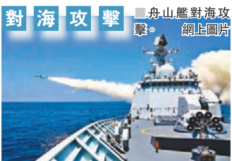
對海攻擊 舟山艦對海攻擊。