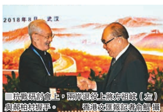
抗戰研討會上,兩岸退役上將方祖岐(左)與郝柏村握手。

香港文匯報訊(記者俞鯤、實習記者曾媛武漢報道)來自兩岸的退役將領、學者和大學、高中師生近300人昨日在湖北武漢參加「中華民族抗戰歷史教育與抗戰精神傳承研討會」,共同發出兩岸傳承光榮抗日戰史、加強抗戰歷史教育、傳承抗戰精神的歷史強音。出席活動的中共中央台辦、國務院台辦副主任龍明彪強調,新時代兩岸更要順應歷史大勢,共擔民族大義,共同推動兩岸關係和平發展,推進祖國和平統一進程,共圓中華民族偉大復興的中國夢,這是對歷史的最好紀念,對抗戰精神的最好弘揚,也是對所有為國家民族奉獻、犧牲的先烈先賢的最好告慰。