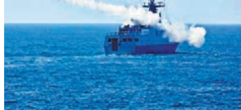
攔截目標 發射防空導彈攔截空中目標。