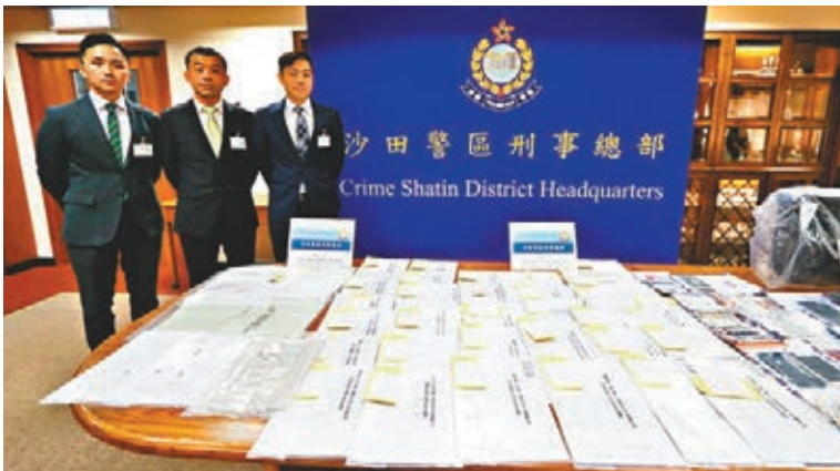
■警方展示行動檢獲電腦、打印機及不同種類偽造文件等證物。