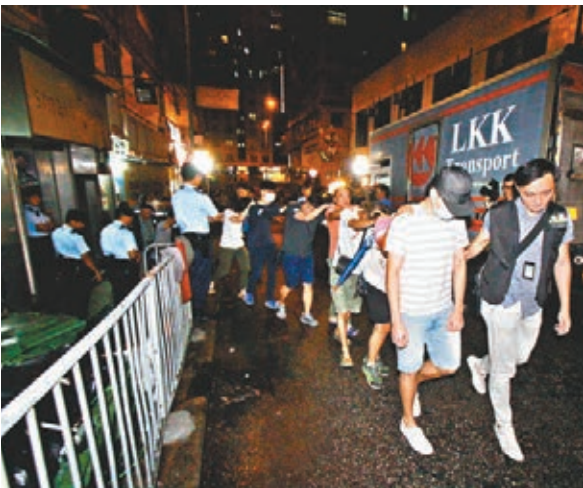
■警方在兩個非法釣魚機賭檔共拘捕13名涉案男女。

被捕95人，48男47女，20歲至81歲，包括非法賭檔主持人、同黨及賭客，部分人有黑幫背景，分別涉嫌經營賭博場所、街道上營辦非法賭博、協助在街道上營辦非法賭博、在賭博場所內賭博、在街道上賭博及藏有攻擊性武器罪名。被捕人中兩人為學生。