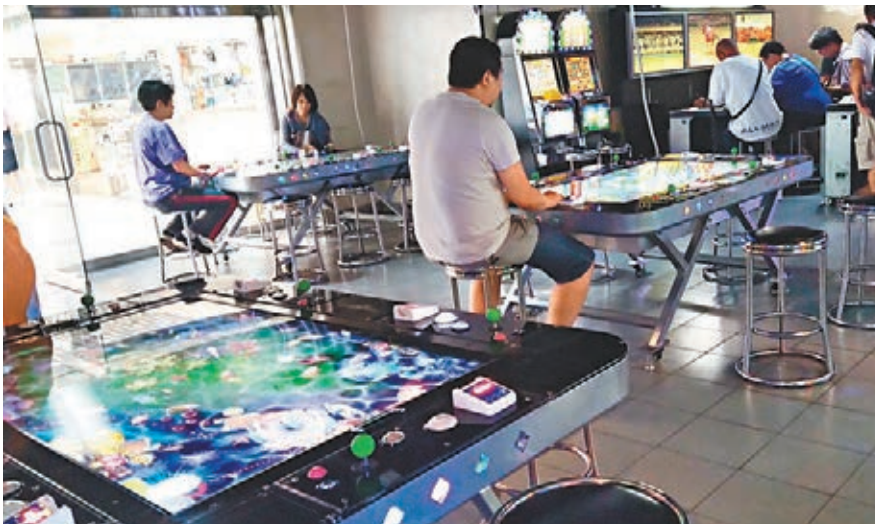
■本港不少遊戲機中心設有釣魚機、老虎機及跑馬機。

香港文匯報訊（記者 蕭景源、劉友光）警方通宵展開代號「雷霆18」、「犁庭掃穴」及「飛魚」打擊非法賭博行動，於11小時內在香仔、深水埗、旺角及觀塘共破獲六個非法賭檔，拘捕95名男女。其中香港仔成重災區，破獲一個紙牌賭檔及兩間非法釣魚機遊戲機中心，共拘捕50人，包括兩學生疑暑假在機舖消遣期間遭利誘協助為賭客積分兌換金錢，一旦罪成，恐會前途盡毀。