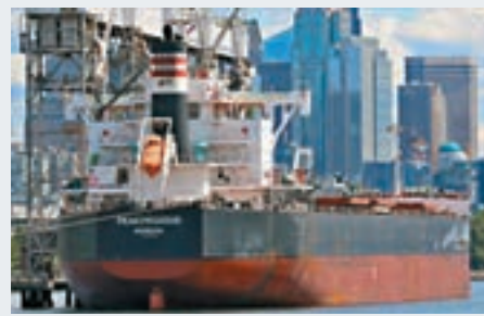
美國貨輪「飛馬峰號」。

報道稱,這艘船由摩根大通資產管理公司擁有,而船上大豆的擁有者則是一家叫路易·德雷福斯的總部位於阿姆斯特丹的農產品貿易公司。後者據信需要