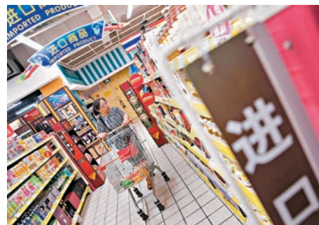
美聯社引用數據顯示,今年7月中國進出口貿易呈增長態勢。圖為民眾正在挑選進口商品。

裁員,原因是生產電視機的零部件價格上漲。廠家表示,許多零部件自中國進口。受關稅措施影響,零部件價格普漲,廠家難以承受。