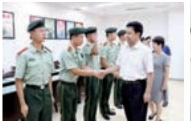
陝西省政協秘書長閻超英慰問駐省政協武警官兵。