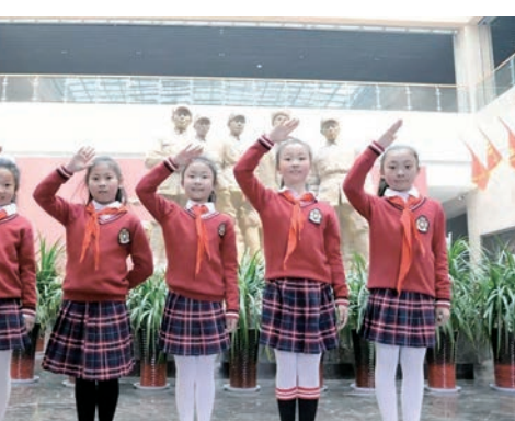
學生利用假期到革命聖地參觀學習。

「國防教育在內容上要回歸本真，但形式上要依據時代要求不斷創新。只有持續增強國防教育的時代感和吸引力，才能召喚更多