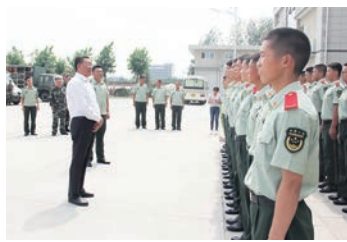
山西省銅川市政協主席張惠榮看望慰問武警官兵。資料圖片