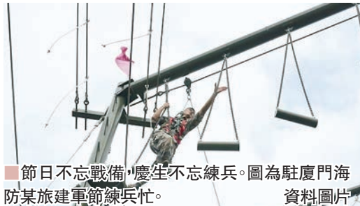
節日不忘戰備，慶生不忘練兵。圖為駐廈門海防某旅建軍節練兵忙。

黨的十九大報告明確提出，要讓軍人成為全社會尊崇的職業。「八一」前夕，退役軍人事務部、財政部發出通知，再次提高部分退役軍人和其他優撫對象等人員撫恤和生活補助標準：傷殘人員殘疾撫恤金標準、「三屬」定期撫恤金標準、「三紅」生活補助標準在現行基礎上提高10%，在鄉老復員軍人生活補助標準在現行基礎上每人每年提高1,200元（人民幣，下同），烈士老軍子女生活補助標準由現行每人每月390元提高至440元。這是中國自改革開放以來，國家第25次提高殘疾軍人殘疾撫恤金標準，第28次提高「三屬」定期撫恤金標準和「三紅」生活補助標準。全國政協委員、解放軍原總政治部主任助理岑旭表示，體現了黨和政府對退役軍人和其他優撫對象的關心關愛。