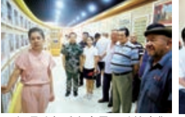
新疆吐魯番市高昌區政協參觀愛國主義教育基地。資料圖片