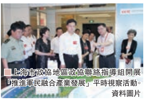
上海市政協地區政協聯絡指導組開展「推進軍民融合產業發展」平時視察活動。