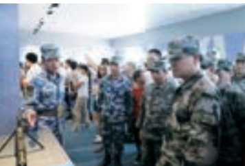
福建省泉州市鯉城區政協參加石獅市過「軍事日」活動。資料圖片

軍愛民，民擁軍，軍民魚水一家親。「八一」建軍節到來之際，連日來，全國各地政協通過開展「軍事日」活動、參觀愛國主義教育基地、慰問退伍軍人等各種方式，接受國防教育，體驗軍事生活，推進強軍建設，增強國防意識，密切軍地關係。下圖為各地政協委員「擁軍」剪影。