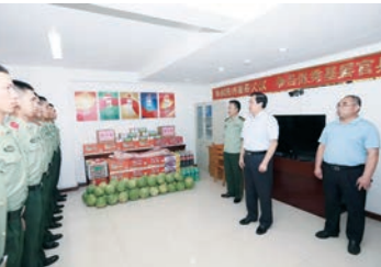
河南省政協秘書長王樹山慰問駐省政協武警官兵。