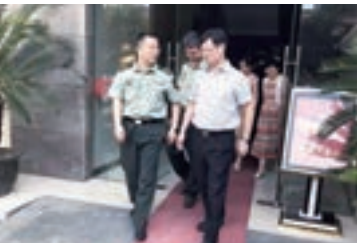
杭州市拱墅區政協主席周志輝慰問省軍區官兵。資料圖片