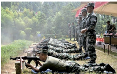
貴州省從江縣四大班子領導赴武裝部隊開展「軍事日」活動。資料圖片