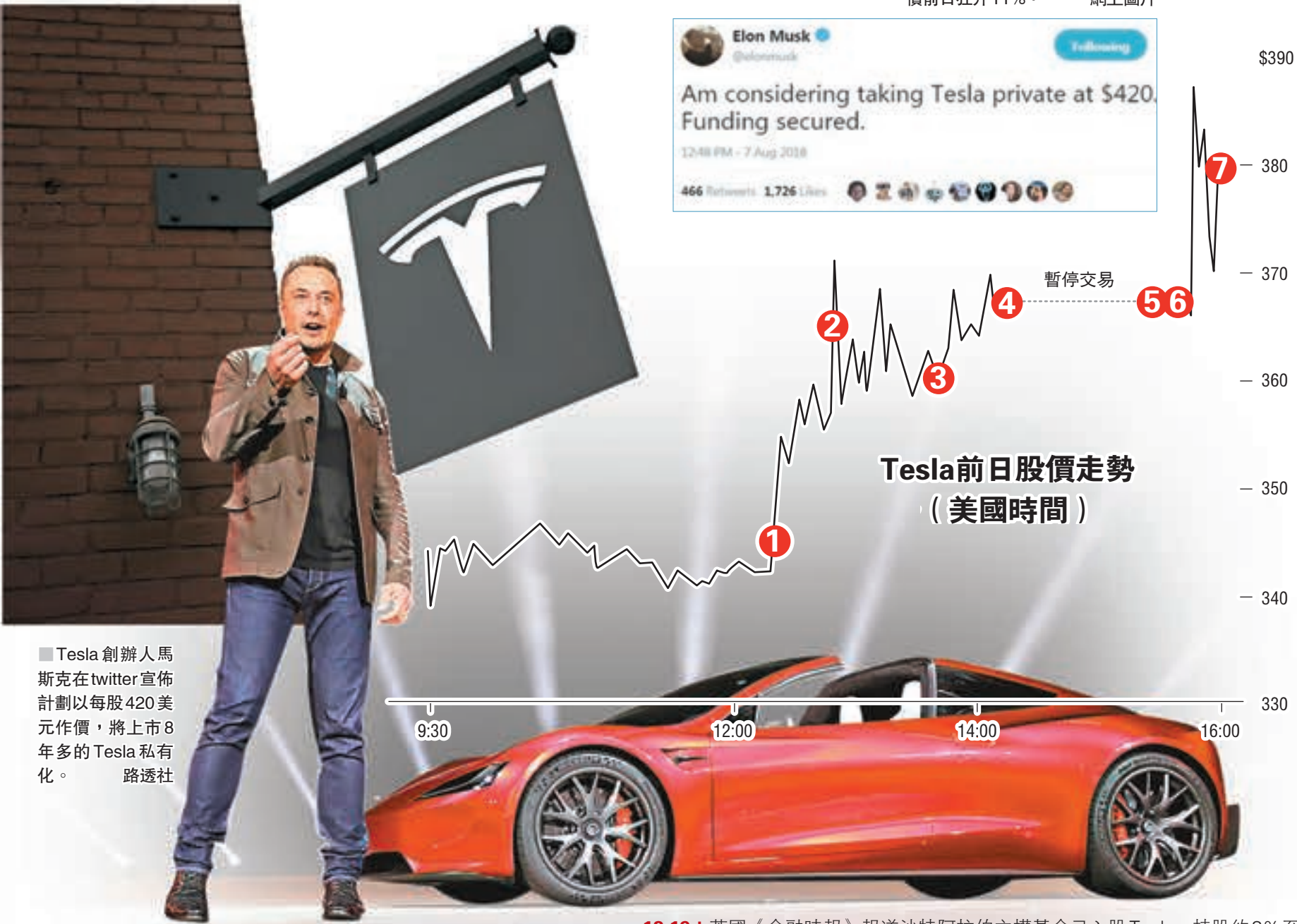
■Tesla創辦人馬斯克在twitter宣佈計劃以每股420美元作價，將上市8年多的Tesla私有化。