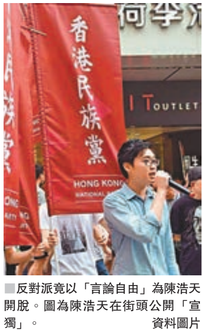
反對派竟以「言論自由」為陳浩天開脫。圖為陳浩天在街頭公開「宣獨」。